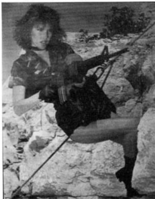
Den marxistiskt inspirerade, feministiska offensiven i vårt samhälle har bland annat lett till ett ökande antal kvinnor i det militära...

Ett annat marxistiskt tankesätt som lever kvar är utsagningsmyten. Än i dag lärs det ut i svenska skolor att västerländsk utsugning är orsaken till att u-länderna är fattiga. Detta grundar sig bland annat på upprörda röster om hur oerhört låga löner arbetarna betalas i u-länderna och om hur detta innebär att mervärdet i produktionen suges ut från u-länderna. Märkligt nog så reflekterar de aldrig över varför u-länderna välkomnar och slåss om västerländs-