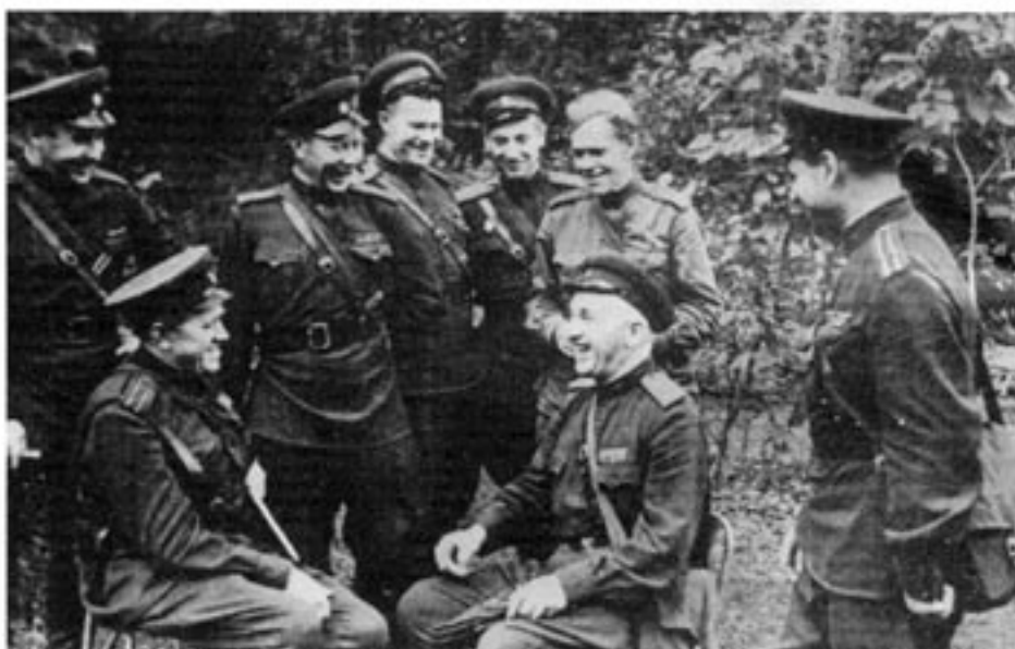
General Grigorenko ses här sittande till höger under en manöver med sovjetiska Femte armén 1963, året innan han greps.

Grigorenkos krigstida tjänstgöring hade varken saknat kontroverser med överordnade eller faromoment. I det stora hela hade han emellertid klarat sig med bravur; ett skadat ben var den enda kroppsliga skavanken, och en lysande militär karriär tycktes ligga framför honom. Det var också med entusiasm och ett brinnande engagemang han tog sin an de arbetsuppgifter som förestod. De flesta officerskolleger sökte sig till någon aktiv befälspostering i det vidsträckta sovjetimperiet, men den