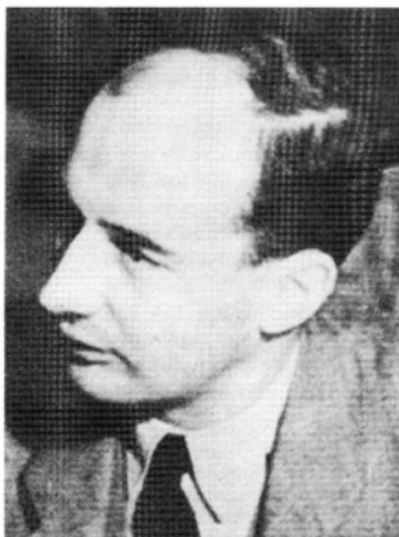
Den välkända bilden av Raoul Wallenberg, otaliga ungerska judars räddare undan Eichmanns dödspatruller i Budapest.

Men kaos hotade i Budapest. Ungerska nazister (pilkorsare) grep judar på gatan, sköt dem eller förde dem till läger för vidare transport. Samtidigt närmade sig Röda armén från öster. Räddningen bräddskade och kunde genom Raoul Wallenberg lägga in en högre växel. Denne uppfann ett nytt dokument, skyddspasset, som ställde bäraren och hans bostad under legationens beskydd i väntan på avresan till Sverige. Passet ville imponera på byråkratsjälur: vapnet Tre kronor,