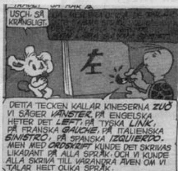
Skalman undervisar i kinesisk marxism-leninism