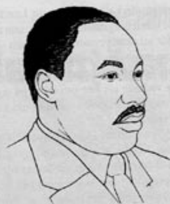
Martin Luther King, Jr. – tivelaktig akademiker.

Contras elektroniska veckobrev kan beställas (gratis) från contra@algonet.se