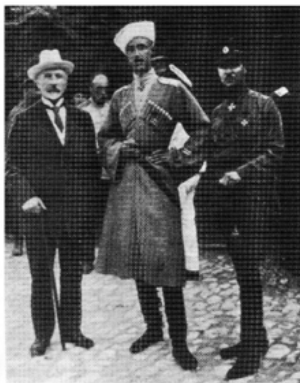
Den vite generalen, baron Peter Nikolajevitj Wrangel (i mitten), med sin premiärminister och stabschef i augusti 1920. Wrangel var de vitas sista hopp i kampen mot bolsjevikerna.

kontrarevolutionära regeringen i Ryssland. Han erkändes av Frankrike som riksföreståndare.