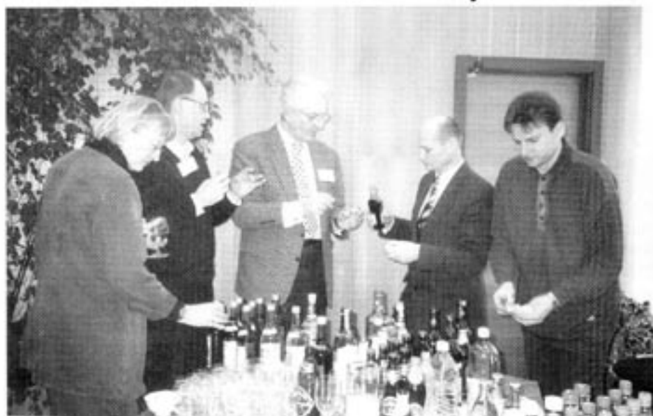
Staden Visaginas i Litauen har insett värdet av alkoholhaltig representation. Delegater från Sverige låter sig väl smakas under en mottagning i stadshuset. De båda männen till höger på bilden representerar värdarna.

Modern vetenskap bekräftar alkoholens positiva verkningar, ej endast på männis-