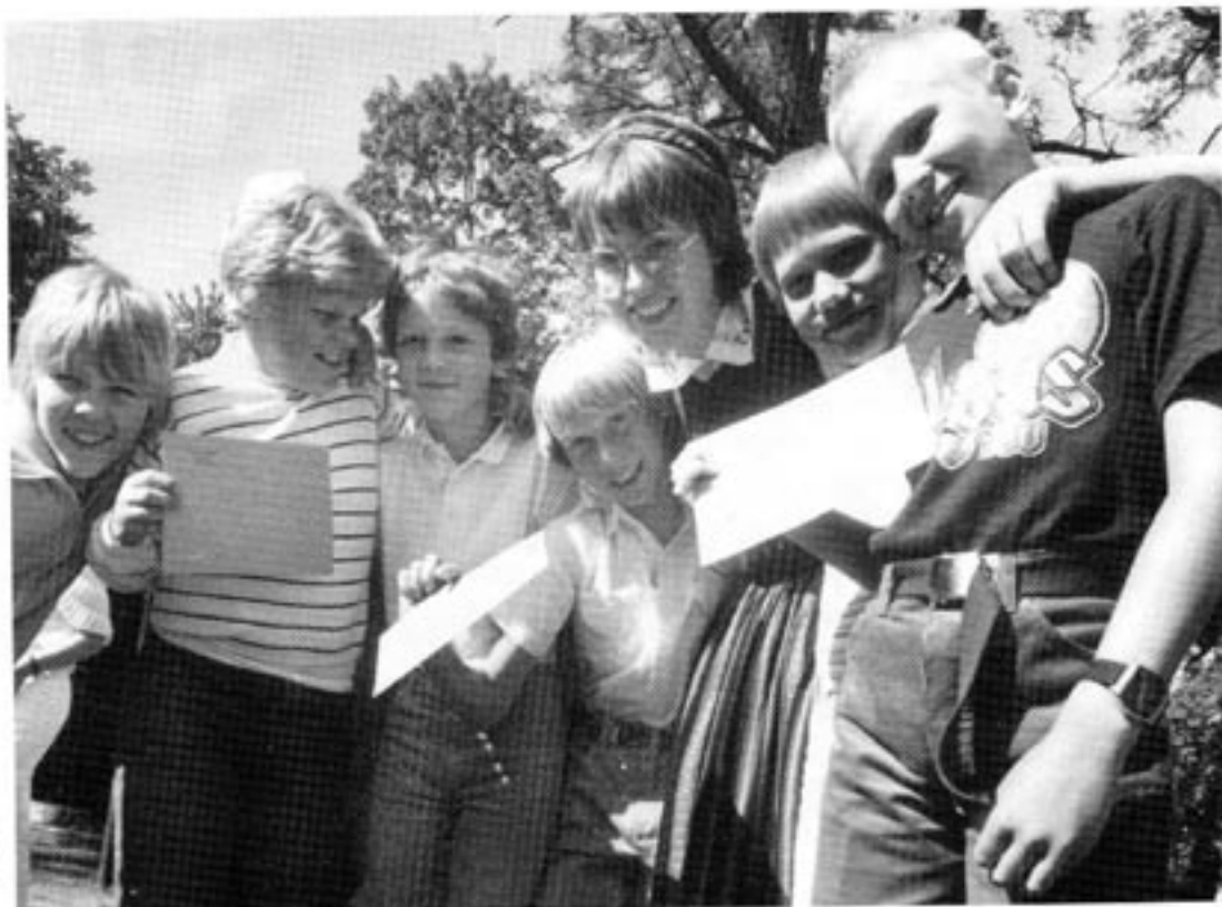
De som är unga i dag har anledning oroa sig över sin framtida pension...