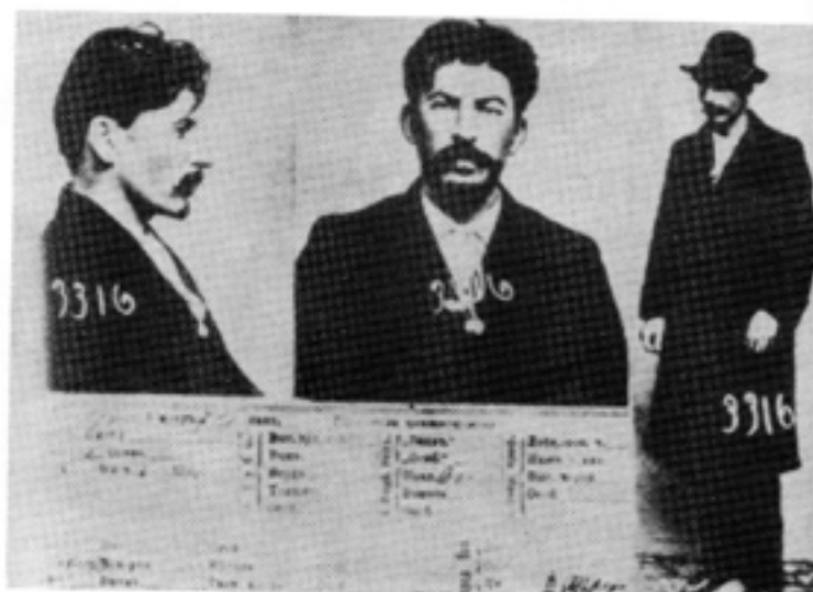
Stalin som ung terrorist i den tsaristiska säkerhetspolisens (Ochranan) register.

Efter Kornilovs död övertog Anton Denikin befälet över den förstnämndes armé och kom med tiden att med sina trupper kontrollera större delen av södra Ryssland. Förutom de ryska soldater som enrullerats i de vitas arméer hade dessa till sitt förfogande kosacker, tjecker, tyskar och västallierade från England, Frankrike och Förenta staterna. Det var framförallt på den södra fronten som de vita hotade de rödas ställningar med ett flertal kompetenta generaler till sitt förfogande. Men där fanns också många orosmoment. Generalerna hade svårt att samarbeta. De var också som regel usla politiker. Dessutom hade de stora problem med att skaffa fram utrustning och hjälp från Rysslands krigstida allierade. Därtill kom det faktum att de vitryska generalerna anslöt sig till den gamla ingrodde ryska antisemitismen; vissa av dem anställde parallellt med sin