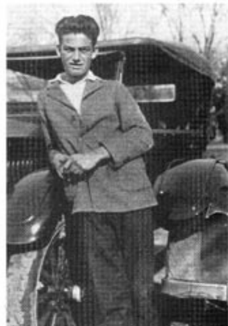
Barry Goldwater som tonåring på 1920-talet.

Att Ronald Reagan 1964 hade varit aktiv i Goldwaters presidentvalskampanj betydde mycket. Men det var ändå en annan konservativ ledargestalt, som betydde mer på gräsrotsplanet. Författaren och opinionsbildaren Phyllis Schlafly publicerade 1964