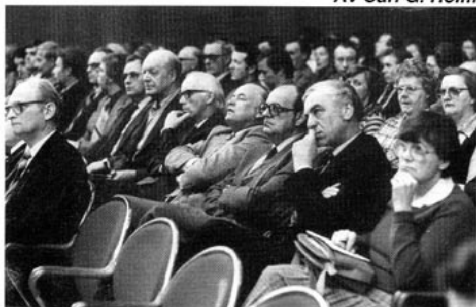
Dagens pensionärer kan tillgodoräkna sig ATP-systemets fördelar.

I de gamla brukssamhällena ingick det i traditionen att bruket även sörjde för de gamla. Men med ökad rörlighet, städer istället för bruksorter och en snabbare industriell omvandling, något som inträffade på 1870-talet och senare, blev brukssamhällets system otillräckligt. På tjänstemannasidan införde de flesta företagen tjänstepensioner för sina tjänstemän. Det vill säga de fick behålla en del av sin lön efter pensionsåldern. En förutsättning var dock att de stannade kvar på företaget ända till pensionsåldern. Ett mer flexibelt system drevs fram i och med bildandet av Svenska personalpensionskassan (SPP) 1913. Då infördes – men bara för tjänste-