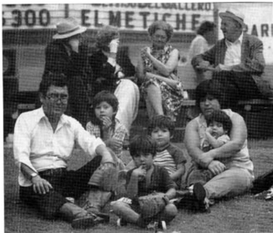
En amerikansk-mexikansk familj kopplar av. Det beräknas att år 2000 kommer personer av så kallad hispanisk härkomst att utgöra 15 procent av USAs befolkning.