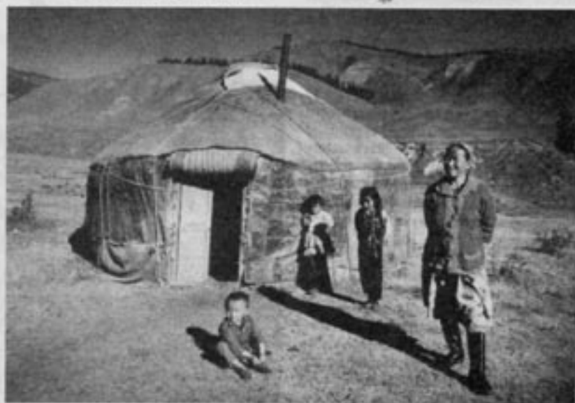
Traditionell östturkestansk (ujgurisk) levnadsstil, nu börjar protesterna mot det kommunistiska förtrycket att intensifieras.

I början av april presenterades det första serieexemplaret av Lockheed Martins nya stridsflygplan F-22 Raptor. F-22 är gene-