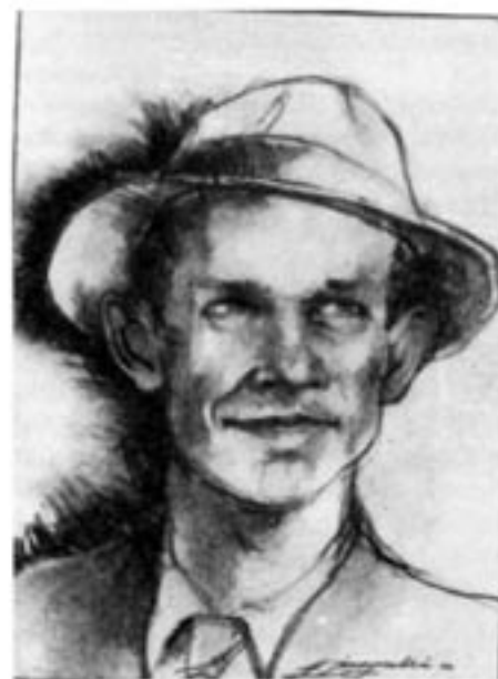
En amerikansk tecknars bild av Alger Hiss i spionens yngre dar. (Teckning: National Review , New York)

Chambers vittnesmål hade föregåtts av ett annat. Elizabeth Bentley hade blivit medlem av kommunistpartiet samma år som Chambers lämnade det. Hon hade, i förhör som inleddes i juli 1948, gjort omfattande avslöjanden av kommunistisk infiltration av den federala administration.