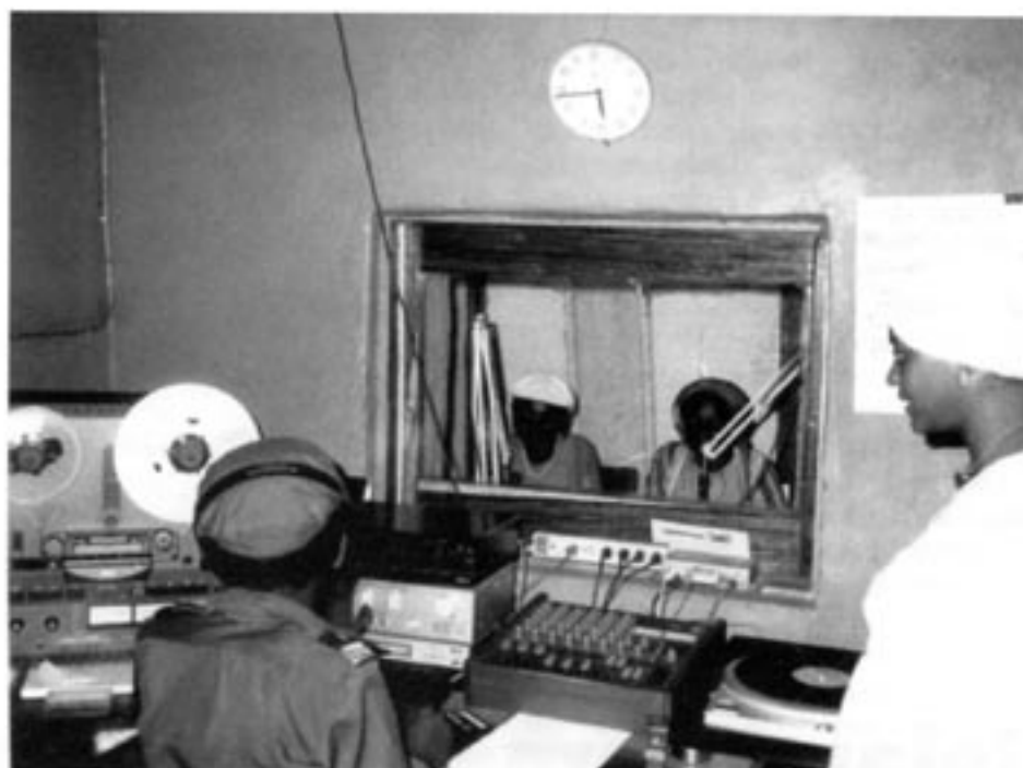
En interiör från UNITAs "Radio svarta tuppen" i det förra gerillahögkvarteret i Jamba i sydöstra Angola.

Bristen på internationellt intresse för kommunisternas våldokumenterade valfusk och våldshandlingar i samband med valen 1992 upplevdes av Jonas Savimbi och hans anhängare som chockerande. Under åren närmast efter det solkiga valet