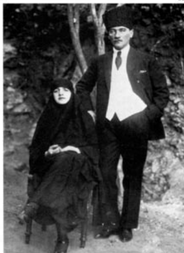
Kemal Atatürk skapade det moderna Turkiet. Observera att han bär västerländska kläder och att hans hustru saknar slöja. Idag finns det islamister som vill gå tillbaka till det gamla.

blivit så värdsamma inför allt möjligt, som kan anses vara "västligt" och "modernt", att västvärldens attityd till Turkiet ofta är nedlåtande, och att, som chefredaktören för en ledande Ankara-tidning nyligen påpekade, "vi turkar ständigt söker efter vår egen identitet".