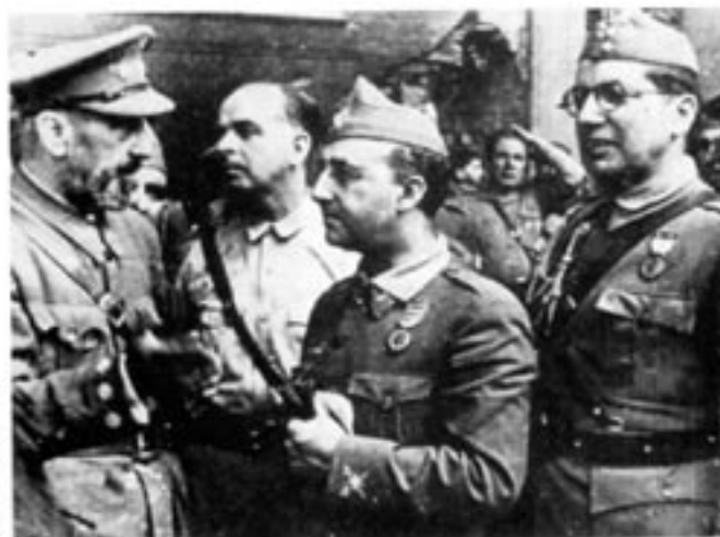
General Franco i centrum på bilden efter erövringen av Toledo tillsammans med fr v Moscardo, Varela och Franco Salgado.

Men då artikel 26 i konstitutionen godkändes, trots protester från en handfull liberala parlamentsledamöter, var konflikten ett faktum. Artikel 26 stipulerade att katolska kyrkan i Spanien skulle underkastas en undantagslag. Lagen påbjöd att samtliga munk- och nunneordnar skulle upplösas och deras verksamhet beskrevs som statsfientlig. Bön, fasta, botgöring och karitativt arbete definierades som kontrarevolutionära handlingar. Lagen trädde i kraft med omedelbar verkan. I maj