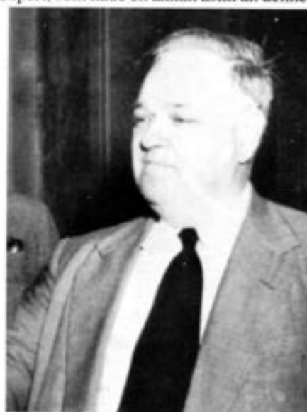
Whittaker Chambers var avhoppad kommunist och fet, ful och luggsliten. Men han berättade sanningen...