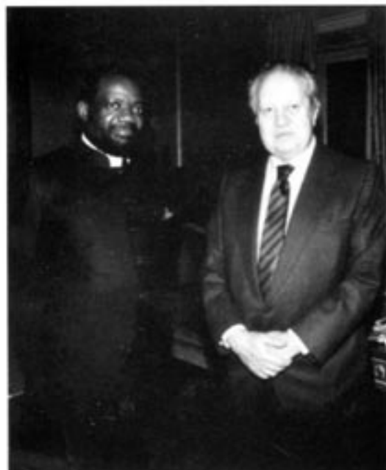
Jonas Savimbi och Portugals förre president Mario Soares, en varm anhängare av UNITA i Angola.

Den 31 maj 1991 inträdde vapenstillestånd i Angola efter avtal ingånget i Estoril i Portugal, och i slutet av september samma år besökte Jonas Savimbi Luanda för första gången på 16 år. Fria val planerades till månadsskiftet september-oktober 1992. Under skydd av regeringsmakten fortsatte emellertid den korrupta MPLA-regimen under ledning av José Eduardo dos Santos att sabotera och brutalisera den politiska processen. Amerikanska underrättelsetjänsten CIA upptäckte övertygande bevis för att MPLA planerade att mörda Savimbi. Under hela perioden mellan stilleståndsavtalet och valet förekom vidare rutinmäs-