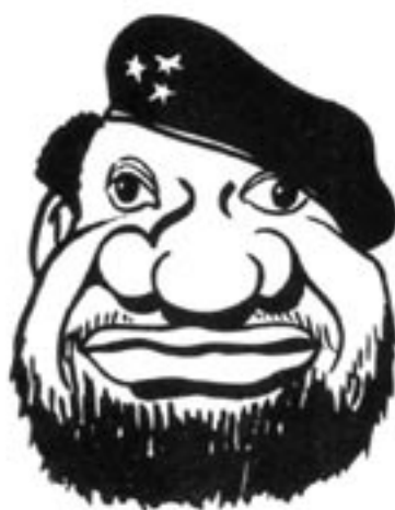
Jonas Savimbi med en karikatyrtecknarens ögon.

En av de viktigaste orsakerna till vänsterns väldokumenterade hat gentemot Savimbi är just att han betraktas som en "svikare", en förrädare mot socialismen.