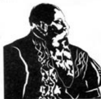
Gustaf Vasa införde reformationen med hård hand.