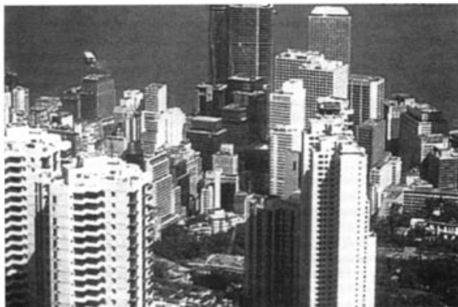
Hongkongs välkända skyline - kommer den att förbli symbolen för österländsk företagsamhet?

Den hatade kommunistiska symbolen blir en hotande realitet i Hongkong från och med juli 1997.