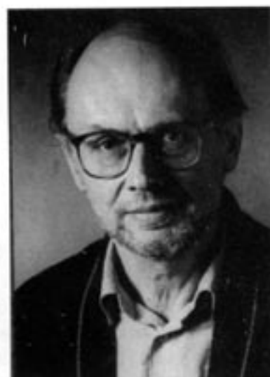
Per Ahlmarks senaste opus är en tungviktare i bokfloden.