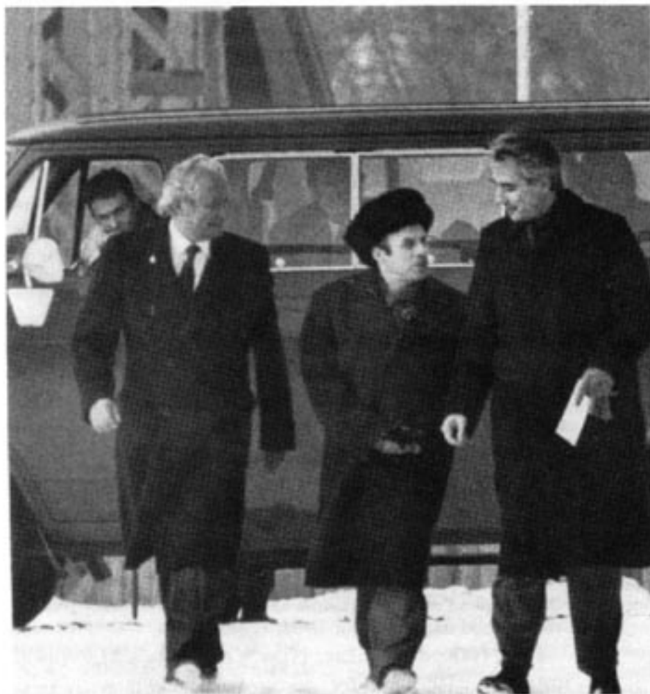
Den 11 februari 1986 frigavs Anatolij (Nathan) Sjtjaranskij i utbyte mot sovjetiska spioner och reste till Israel. På bilden är Sjtjaranskij (i mitten) på väg över Glienicke-bron till Västberlin tillsammans med USAs ambassadör Richard Burt.