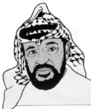
Yassir Arafats ställning som palestinsk ledare blir alltmer ifrågasatt.

1989, 1993 och 1995 (som bäst är man å färd med ett fjärde försök, som säkert blir lika framgångsrikt).