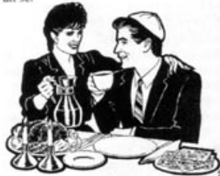
Det judiska folkets framtid i Israel ter sig oviss. Men så har det varit sedan staten Israel bildades...

Vad som skulle bli följden av ett sådant krig är omöjligt att säga. Israel har överlevt flera krig mot höga odds, men man har varit en hårsman från den yttersta katastrofen. Hur det går nästa gång återstår att se.