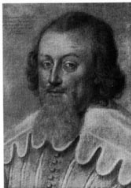
Rikskanslern Axel Oxenstierna satt själv med vid rättegången i Svea hovrätt 1624.