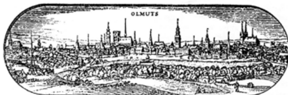
Staden Olmütz i Nordmähren på 1600-talet. Stadens jesuitiska seminarium lockade ett stort antal svenskar.