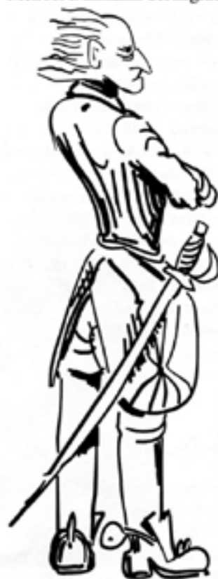
Under Karl XII:s monarki vann Sverige slaget vid Helsingborg 1710. Till tveksamt nytta, menar debattören.