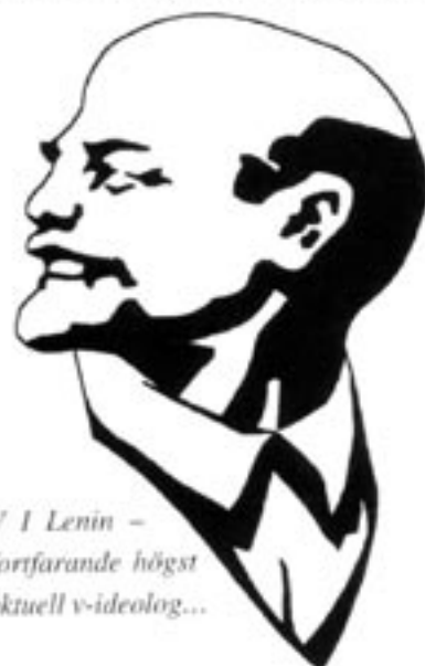
V I Lenin – fortfarande högst aktuell v-ideolog...

Partiet säger sig också vara positivt till teknik och vetenskap, men understryker att mänskligt kunnande kan missbrukas. Och visst kan det det. Dessvärre är deras exempel inte särskilt lysande: