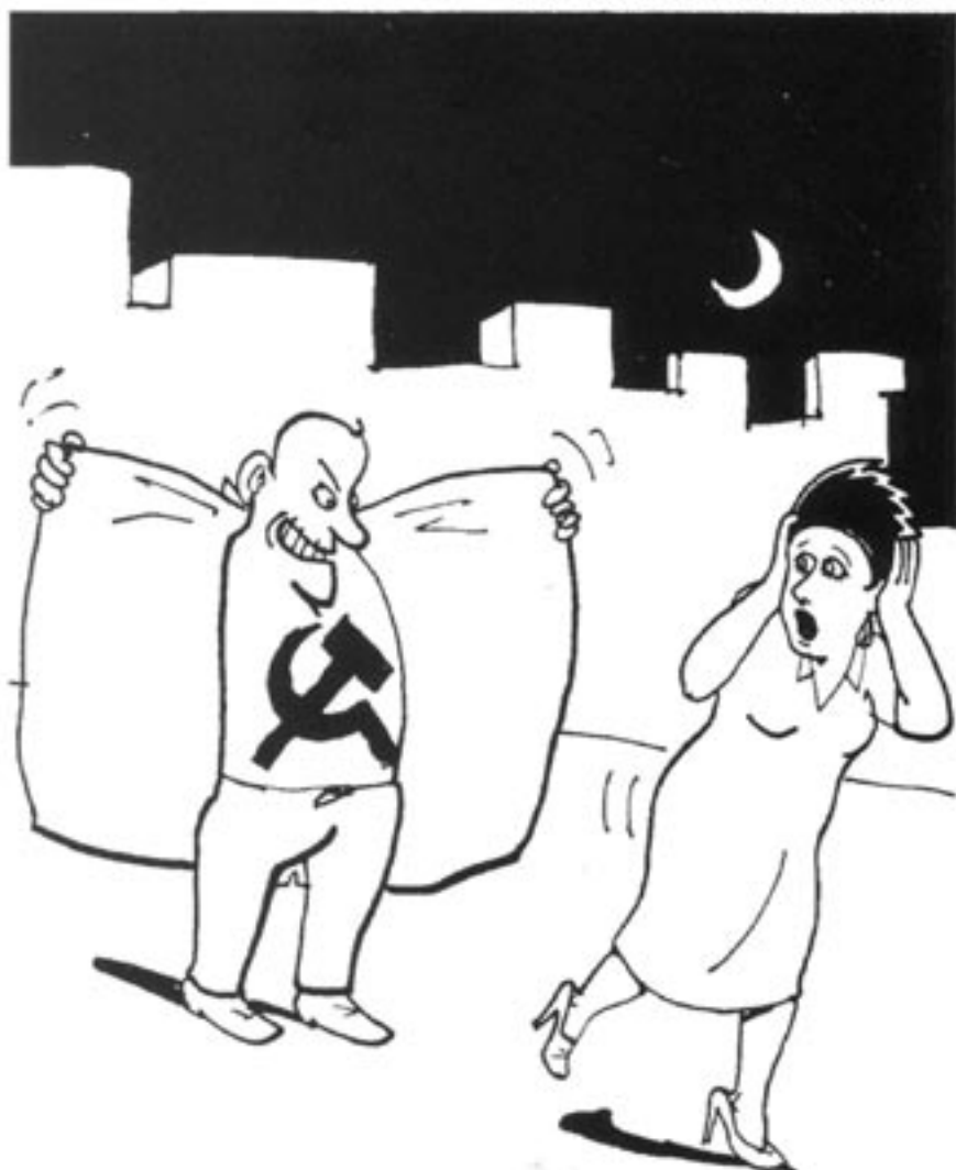
Vänsterpartiet är i grund och botten fortfarande ett kommunistiskt parti – det visar en läsning av partiets nya program.

"Innehållet i besluten bestäms sedan i grunden av styrkeförhållandena utanför