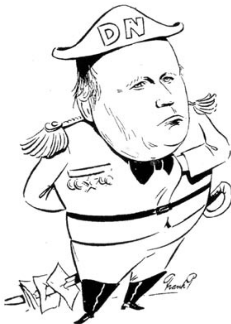
Herbert Tingsten som "den svenska publicistikens Napoleon" enligt en teckning i Tiden 1946.

För Tingsten var det ogörligt att gradera