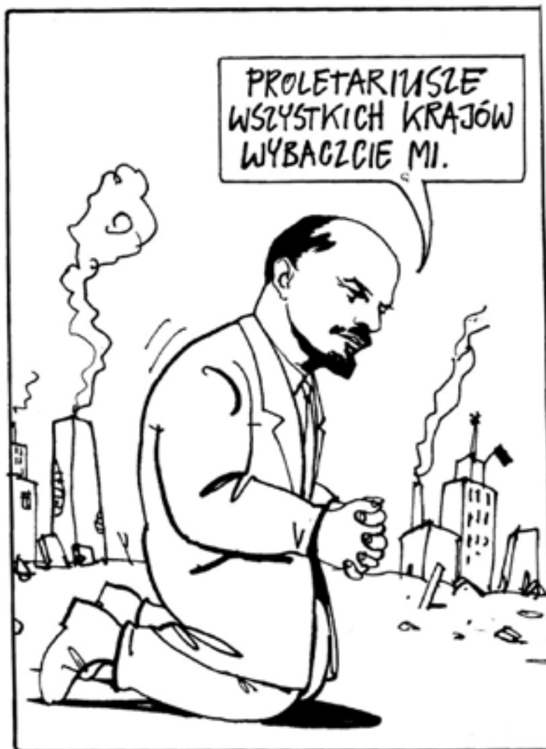
–Proletärer i alla länder, jag ber så mycket om ursäkt! säger Lenin enligt denna polska skämtteckning. Något för Chrisopoulos och alla andra avdankade kommunister att begrundas.

När det gäller resultatet av motionen 1987, så avstyrktes den av konstitutionsutskottet och avslogs av riksdagen. När det