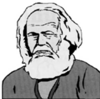
Karl Marx – alljämt en favorit i vänsterkretsar...