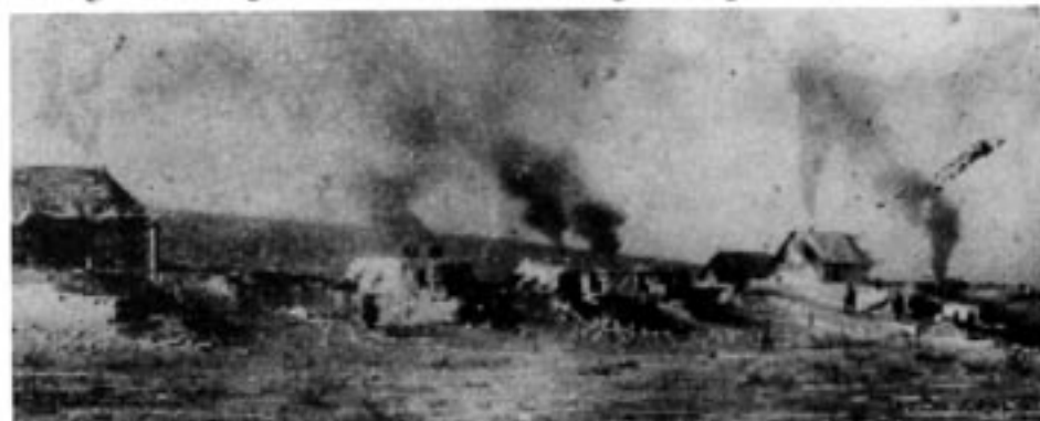
En unik bild – från kolgruveldret Vorkuta när det var bara en by, 1933.

–Sverige är ett viktigt stöd för Baltikum.