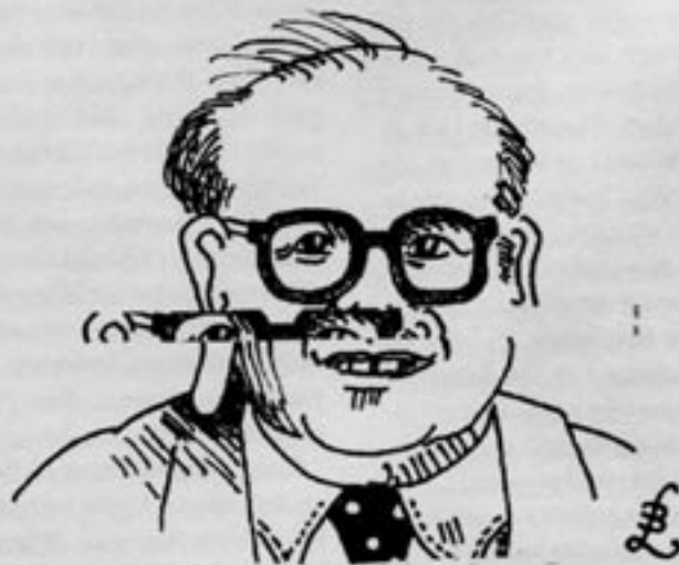
Det påstås att statsminister Göran Persson alltid drar i höger örsnibb när han ljuger.