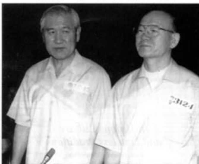
De dömda expresidenterna Roh (t v) och Chun på ett koreanskt tidningsomslag.

Det bör dessutom nämnas – något som till stor del har glömts bort