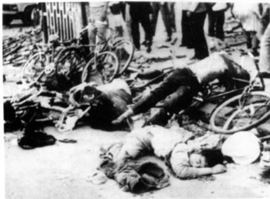
En scen från Himmelska fridens torg den 4 juni 1989...

Fyra flickor, alla under 16, blev torterade för "promiskuöst leverne". De blev inte frisläppta förrän deras familjer betalade 5.000 Yuan (cirka 3.800kr) i böter. I Tibet blev en trettonårig pojke slagen och sparkad av ockupationsmaktens soldater för att ha sjungit tibetansk-nationalistiska sånger. Många fler exempel på övergrepp finns att läsa i den skrämmande