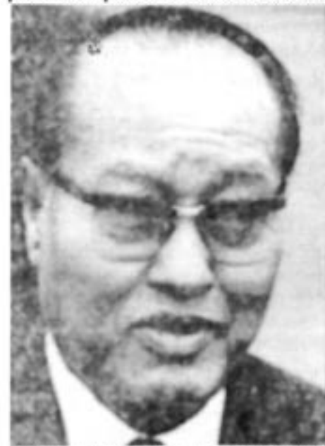
Diktatorn Ne Win kontrollerar fortfarande Burma bakom kulisserna.

Sedan militären slagit ner demonstrationerna i Rangoon, Mandalay, Pagan och andra större städer införde SLORC under generalen Saw Maungs ledning krigslagar – men samtidigt tilläts politiska partier. Den styrande juntan utlovade fria val till maj 1990, de första fria sedan 1960. Eftersom Aung San Suu Kyi placerats i husarrest kunde hon inte kandidera i valkampanjen, men trots detta fick hennes parti NDL cirka 60 procent av rösterna och 81 procent av platserna i nationalförsam-