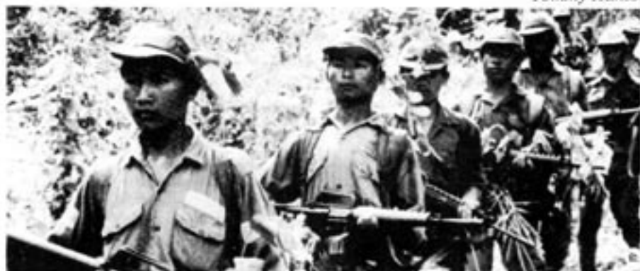
Den burmesiska gerillans villkor kommer till belysning i John Boormans film "Skugga över Rangoon" ( Beyond Rangoon ).