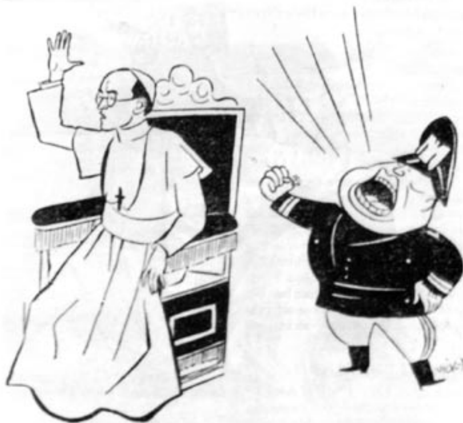
Benito Mussolini, här i en engelsk karikatyr, inledde sin karriär som socialistisk revolutionär.

Skulle nazismen och fascismen placeras med de ideologier de hör hemma hos på vänsterkanten skulle ordet "högerextremism" förlora sin negativa laddning, och sådant ordvrängeri från vänsterns sida skulle bli meningslöst.