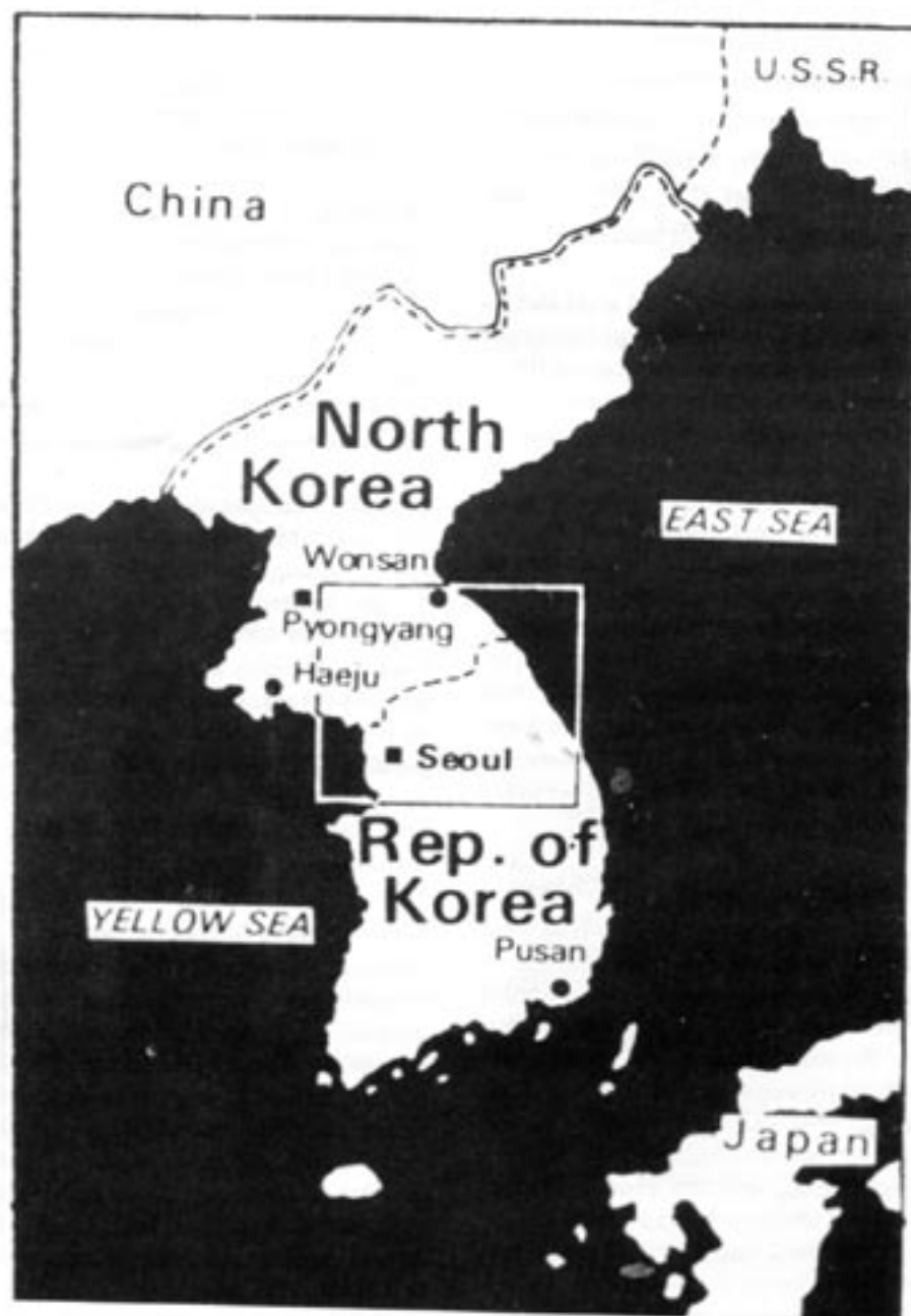
Koreahalvön med den militära demarkationslinjen och gränsområdet mellan Nord- och Sydkorea vid 38:e breddgraden inramad.

Samtliga presidenter efter Park har säkert haft sina förtjänster. Vissa har ansetts svagare än andra, någon har hållits för korrupt och maktfullkomlig. Men ingen har haft Park Chung Hees resning och ingen torde ha varit populärare bland det sydkoreanska folket än vad Park faktiskt var.