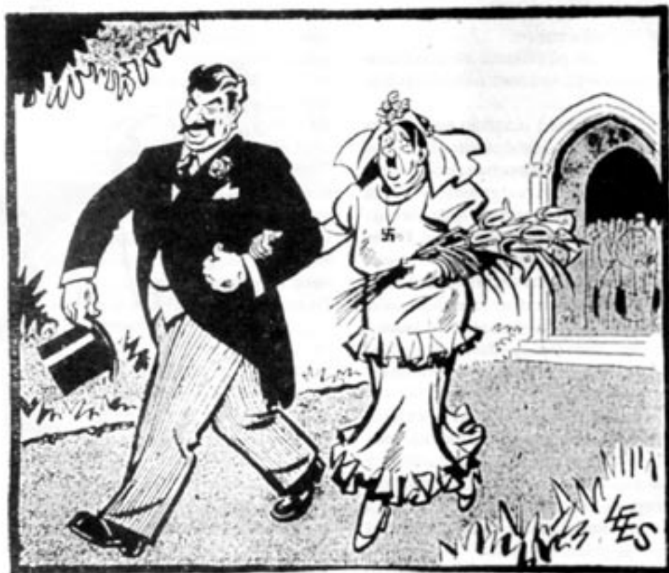
Den "rödbruna röran" i form av samgåendet mellan Stalin och Hitler i augusti 1939. "Efter vigseln" löd rubriken till denna engelska karikatyr i "Sunday Graphic" 1939.

Synen på kapitalet och marknadskrafterna hos de båda tvillingideologierna är intressant. Många tror nog att det här trots allt utgör en skiljelinje mellan ideologierna, vilket bara delvis är sant. Visserligen var företagen i Nazityskland i huvudsak privata och sköttes av privatpersoner (även om de större skulle socialiseras enligt nazisternas program från 1920) men det berodde definitivt inte på någon ideologisk vurm för marknadsekonomi, utan på att Hitler insåg det självklara faktum att pri-