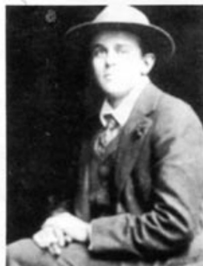
Kommunisten och journalisten John Reed lade grunden för omvärldens positiva syn på de ryska bolsjevikerna.