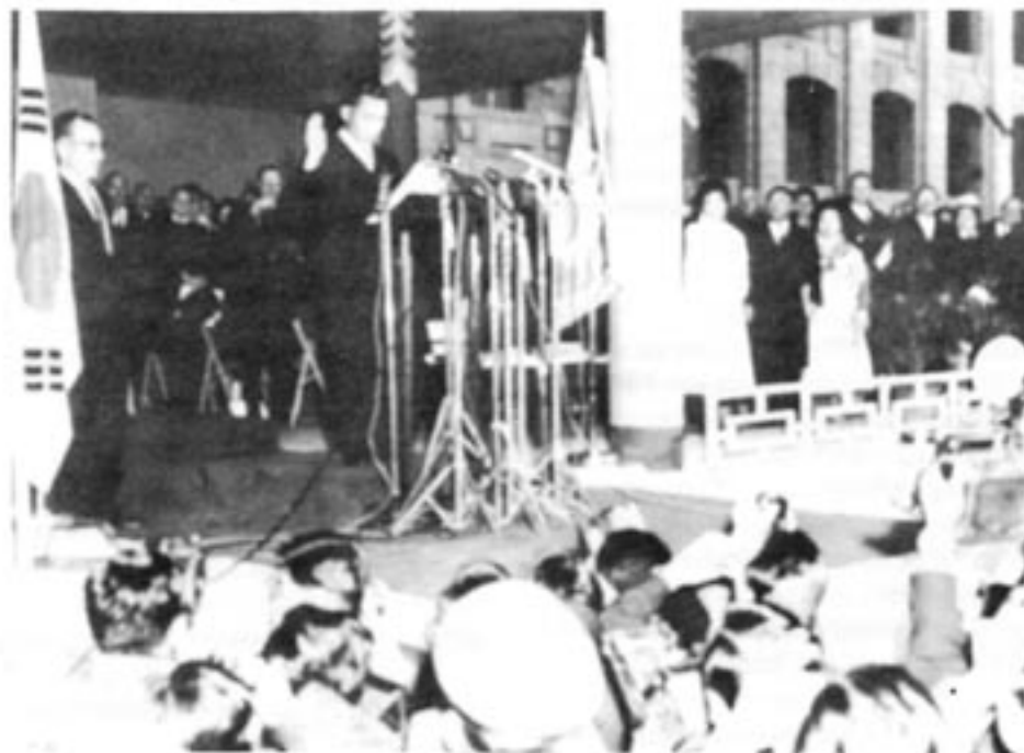
General Park Chung Hee svärs in som den koreanska tredje republikens president den 17 december 1963.

Regeringsskiftet i Sydkorea 1960 har kallats landets första framgångsrika demokratiska revolution. Som vi skall se ledde denna omvälvning tyvärr också till oönskade resultat. Den 15 juli 1960 antog den sittande nationalförsamlingen ett tillägg till konstitutionen som medförde att Sydkorea kom att styras av ett kabinettssystem med ett tvåkammarparlament. Samma dag valde det nyinrättade parlamentets båda kamrar under en gemensam