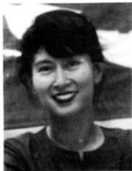
Fredspristagarinnan Aung San Suu Kyi, nu åter i frihet.

motsvarande cirka 2 000 svenska kronor. Ekonomiskt dominerar den svarta marknaden