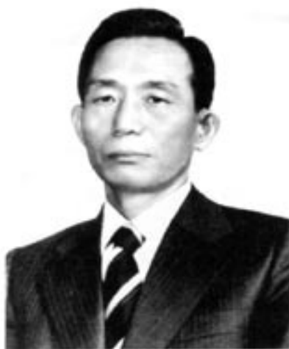
Det officiella porträttet av president Park.

Sommaren 1976 höll världen andan under några dagar sedan nordkoreanska gränssoldater i byn Panmunjom vid 38:e breddgraden huggit ihjäl två amerikanska