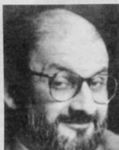
Omuslimsk ränta till den som mördar författaren Salman Rushdie

Muslimerna och marxisterna har en sak gemensamt. De räknar inte ränta. Det strider mot dogmerna. Trots det kännetecknas den muslimska världen av en mycket utvecklad affärsmannakultur där handel och räntor spelar en betydelsefull roll. Det är bara