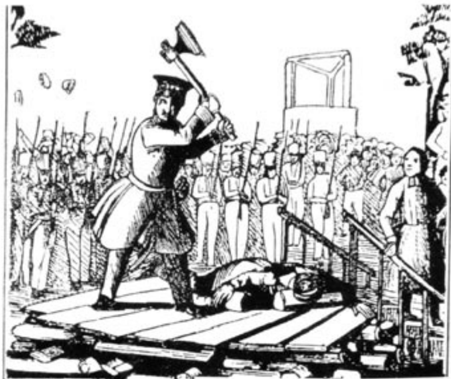
Rättvisa skipas vid en svensk avrättning på 1800-talet enligt en tecknares syn.