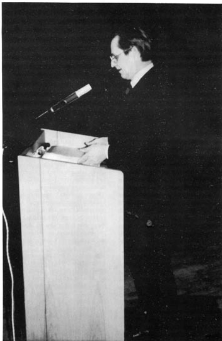
Olof Palme talar vid Estlands nationaldag i Konserthuset i Stockholm i februari 1980. Har privatspanarna svaret på frågan om vem som bragte honom om livet? Contra tvivlar...