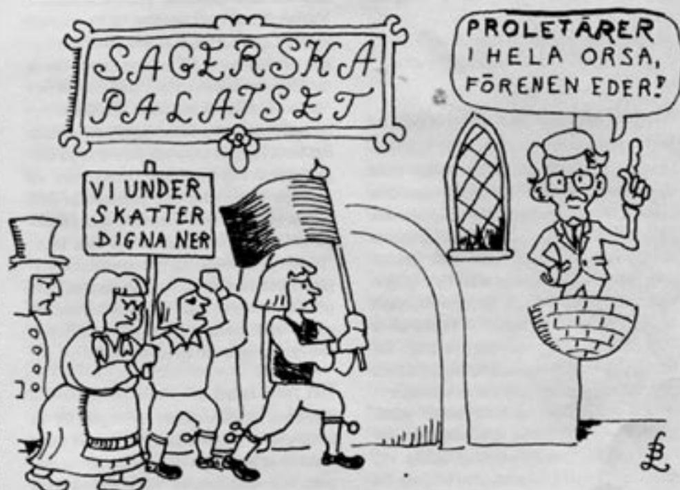
All statsskatt från samtliga invånare i Orsa kommun går åt till att betala statsministerns bostad i Sagerska palatset i Stockholm.