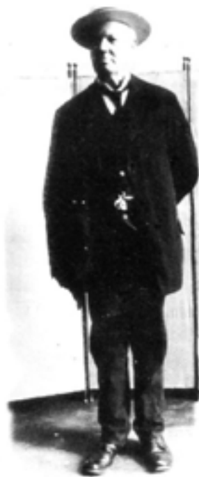
Gustaf Dahlman var riksbödel under åren kring senaste sekelskiftet. Han var bosatt på Kungsholmen i Stockholm.