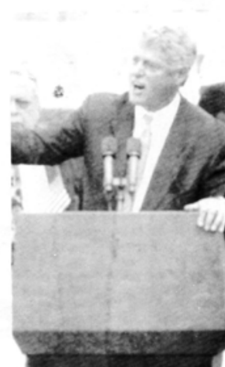
President Clinton tog i mars emot IRA-terroristen Gerry Adams...