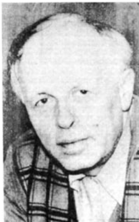
Andrej Sacharov fick Nobels fredspris 1975.

1968 tog han det drastiska steget att skänka alla sina tillgångar (139 000 rubler, då för tiden motsvarande mellan 700 000 och 800 000 svenska kronor) till