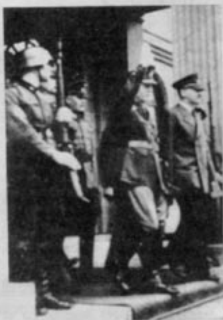
Den nygamla (kommunistvänliga) regimen i Rumänien har plockat fram den gamle Hitler-samarbetsmannen Ion Antonescu som förebild. Här de två potentaterna på en gammal arkivbild.