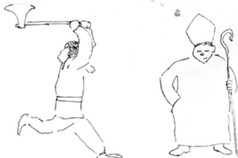
EN TYPIK SVENSK ÖDALSMAN OCH EN TYPIK SVENSK BISP, INVECKLAD I EN TYPIK SCEN AV GIVANDE OCH TAGANDE, TYPIK FÖR SVENSK HISTORIA

Ibland är det sorgligt hur gamla seder kommer ur bruk.