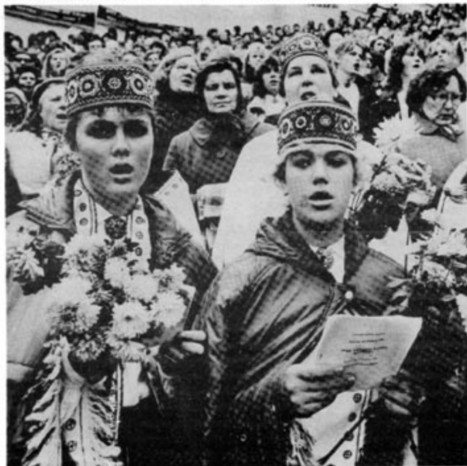
Den lettiska folkkulturen har överlevt den sovjetiska tiden. Här några lettiska kvinnor i traditionella folkdräkter under en folkfest.

Lettland var under sina år som Sovjetrepublik bland de bäst rustade för en teknisk anpassning till en västerländsk ekonomi. I