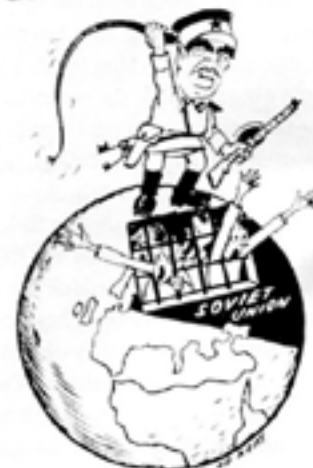
Lenins arv – Sovjetunionen – enligt en västlig skämttecknare.

Den 14 december samma år avled han. Han går till historien som en av de hjältar som starkast bidrog till Sovjetunionens och kommunismens fall.