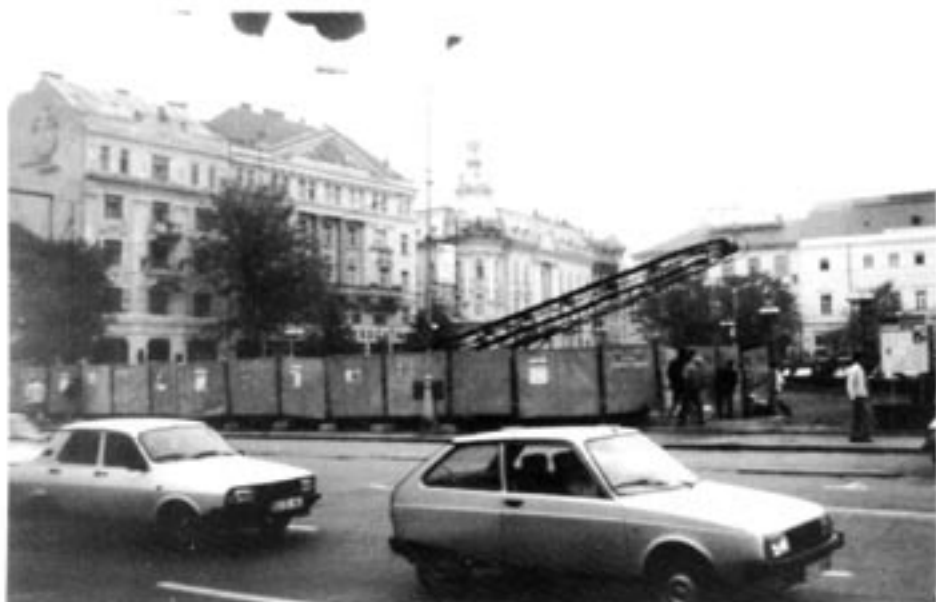
Bakom staketet på bilden i den transsylvanska staden Cluj-Napoca – på ungerska Kolozsvár – pågår utgrävningar sedan i somras, av ungrarna ansedd som ett led i en pågående "rumänisering".

Punkt 16: "Transsylvanien var, är och kommer alltid att vara vårt! Men tyvärr är dess heliga rumänska jord ännu nedsmutsad av hunnernas (= ungrarnas), zigenarnas och andra folkresters asiatiska fötter. Låt oss förena oss och jaga ut dem från landet." Punkt 18: "Föreningens förstärkingsuppgift är förverkligandet av skrämelse i olika former. Således kommer motståndarnas mest begåvade ledare att elimineras eller sättas på neutralt område..."