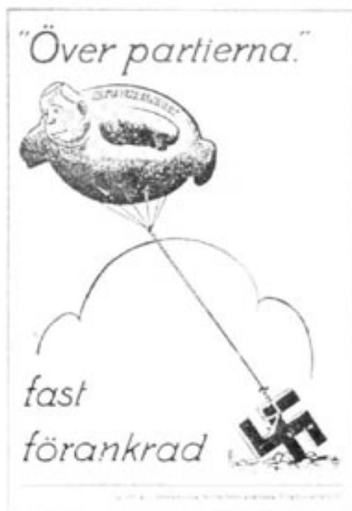
Så här såg kritiska karikatyrtecknare på Aftonbladet under 1930-talet.