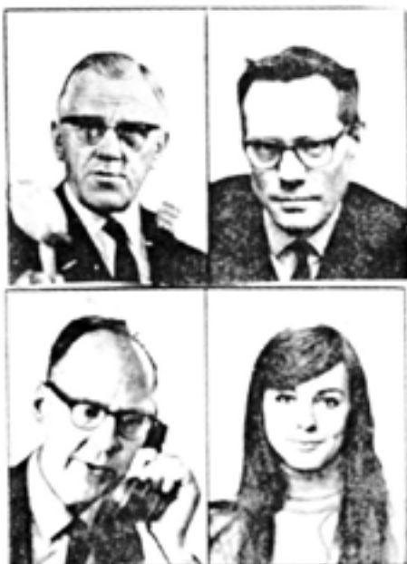
Några av ABs makthavare i modern tid.

Aftonbladet av år 1995 lever varken upp till 30- och 40-talens eller 60- och 70-talens propagandistiska nivå. Men vänsterlinjen dominerar alltjämt, inte minst socialt och kulturellt. Detta är dock inte något unikt för Aftonbladet utan utmärker de flesta tidningar. Ty hur skulle det kunna vara annorlunda när fortfarande Sveriges journalister i undersökning efter undersökning visar sig ha oproporionerligt stora vänstersympatier?