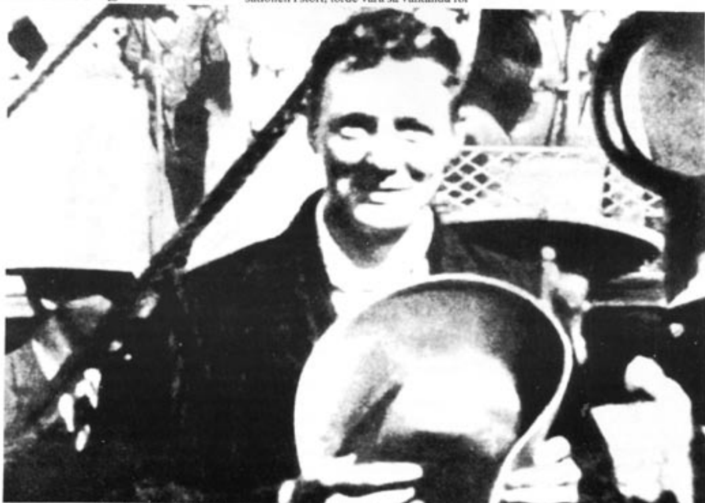
Vid sin ankomst till Durban i Sydafrika på nyåret 1900, sedan han flytt från krigsfångenskap hos boerna, blev Churchill föremål för ovasionsartade hyllningar.

Churchill var en lysande "krispolitiker" – han fungerade bäst då det blåste som snålast, ofta med en flaska whisky och en låda cigarrer inom räckhåll. Han blev ett Forsynens redskap i en svår och förvirrad tid.