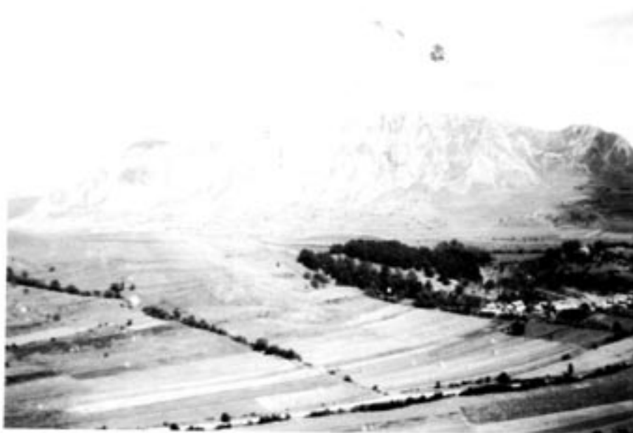
Szekelykö, en jättestor kalkstensklippa invid Torockoszentgyörgi, maximihöjd 1160 m, ca fyra km lång.

Priset på konstgödsel, ogräsbekämpningsmedel m m har blivit så högt att bönderna har allt mindre råd att köpa dem (således har under de första sju månaderna 1994 endast en femtedel av det beräknade behovet av konstgödsel köpts. Bönderna för en heroisk kamp: lån beviljas godtyckligt och efter en byråkratisk procedur med kraftiga inslag av korrupktion, på kort tid och på hög ränta (storleksordningen 80 procent; med hänsyn till inflationen inte så hög som det ser ut, men svår att återbetala för bönderna som nyss har börjat bedriva privat jordbruk).