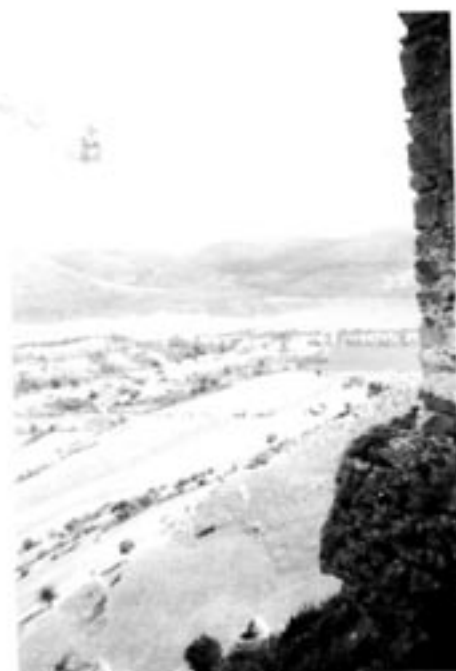
Den ungerska byn Torockoszentgyörgi, på rumänska Coltesti, söder om Kolozsvár.