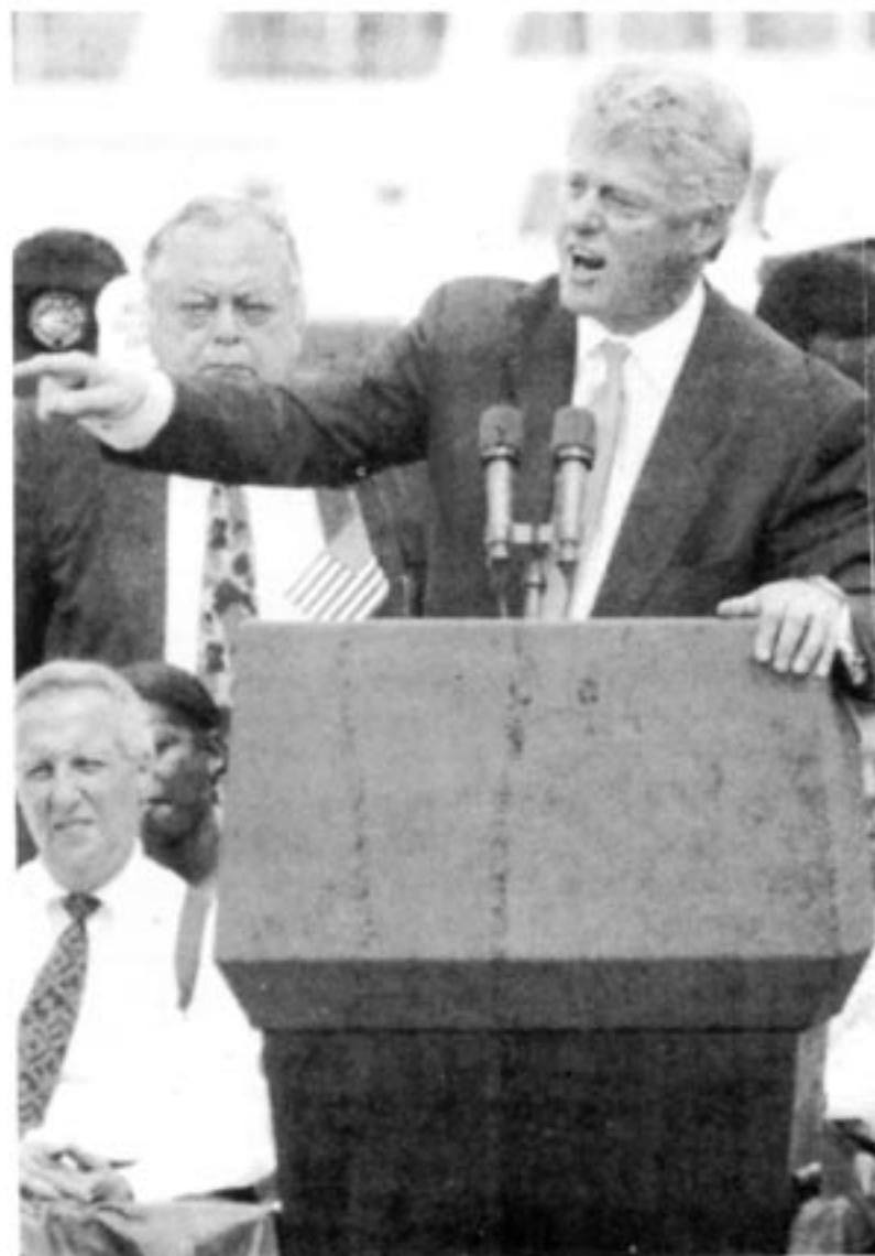
Bill Clintons förvirrade utrikespolitik har blivit en belastning för såväl USA som det demokratiska partiet som vid senaste kongressvalet förlorade majoriteten i både senaten och representanthuset.

Sedan Aristide vänt ryggen mot den vänsterkoalition under vars fana han valts till president, inledde han sitt diktatoriska styre genom att avlägsna en rad borgmästare i landsorten från sina ämbeten och ersätta dessa med företrädare för Lavalas, en löslig koalition trashanksradikaler och marxistiska aktivister där Aristides mest