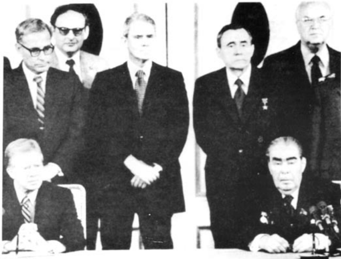
Jimmy Carter (längst t v) ansågs länge vara USAs svagaste president någonsin i utrikespolitiska frågor. Hans utrikesminister Cyrus Vance (stående snett bakom Carter) var legendarisk för sitt dåliga omdöme. Det har emellertid visat sig att Clinton och hans utrikesminister Warren Christopher ("Cyrus Vance utan karisma") är ännu värre. På bilden syns topprankade amerikaner i samband med förhandlingar med höga sovjetiska ledare med president Leonid Brezjnev och utrikesminister Kosygin i spetsen.

Och varför envisas Washington med att skicka fjäskande emissarier av typ Jimmy Carter till slaktare såsom framlidne Kim Il-sung (och hans son Kim Jong-il) i Nordkorea och Li Peng i Kina? Frågorna kunde göras många fler. De har ännu inte fått några godtagbara svar.