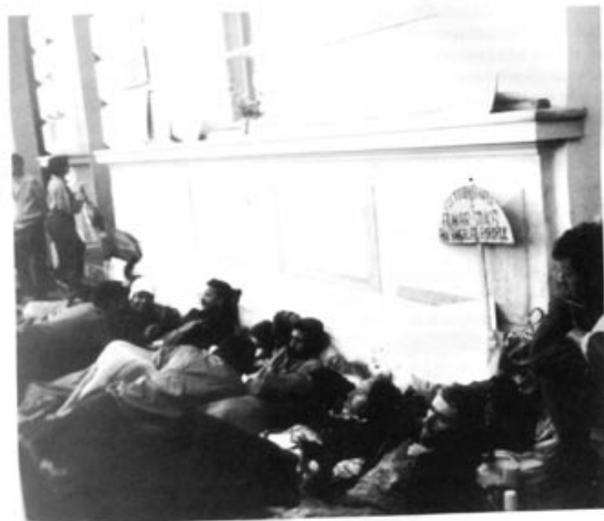
Hungerstrejkande människor vid torget i Cluj-Napoca (ungerska Kolozsvaar, tyska Klausenburg) vilka förlorat sina besparingar på Caritas.

Också våren 1990 började en del av pressen anklaga ungrarna i Szekler-området (Szekelyföld) för att de hade "dödat rumäner" – när det i verkligheten handlade om att man den 21-22 december lynchade några allmänt hatade Securitate-officerare (vilket hände i hela landet).