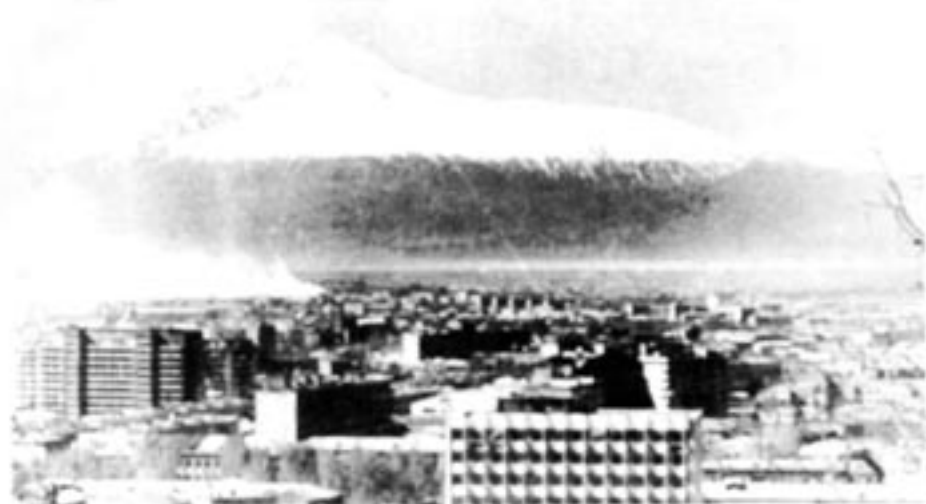
Armeniens huvudstad Jerevan ligger nära berget Ararat som syns i fjärran. Ararat, där Noaks ark strandade, ligger dock på den turkiska sidan av gränsen.