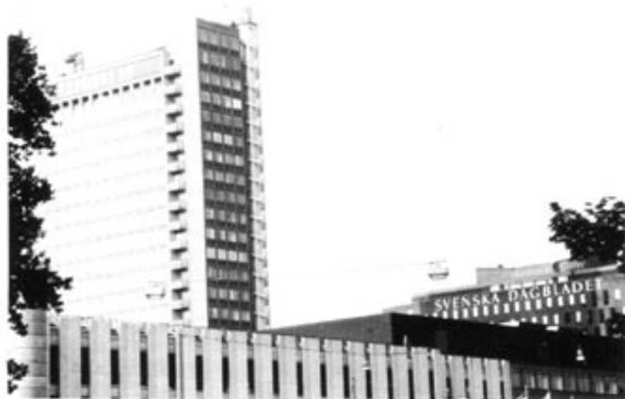
Att yttrandefriheten gällt svenska tidningar har sedan länge varit självklart. Däremot dröjde det länge – till 1993 – innan samma frihet kom att omfatta radion.