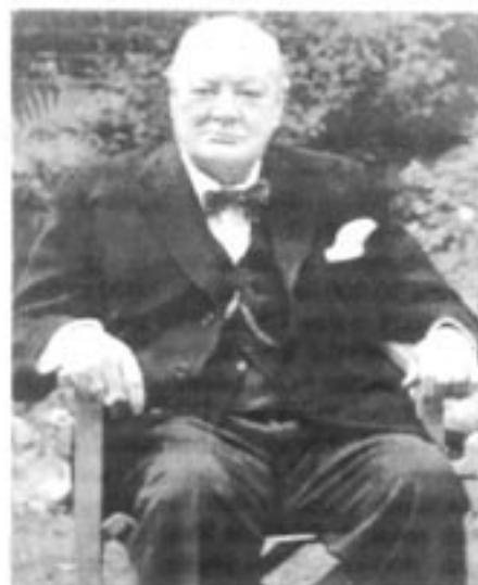
Winston Leonard Spencer Churchill på äldre dagar, mätt på ära och berömmelse.

Winston Leonard Spencer Churchill (1874-1965) var av en annan mening. Han hade tvingats bevittna hur västmakterna i Jalta den 4-11 februari 1945 gått med på eftergifter gentemot Moskva på punkt efter punkt. Vad västerlandets politiker hade