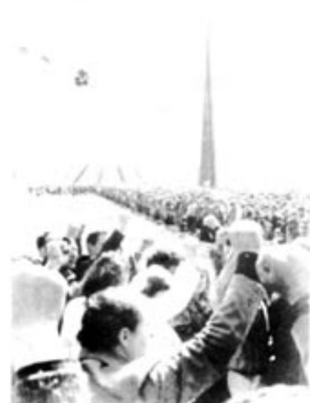
Armenier i hela världen minns turkarnas folk mord på armenier 1915. I Jerevan finns ett monument till offrens minne, som är en samlingspunkt för antimuslimska manifestationer.

Det går bra att rekvidrera tidigare nummer av Contra för 25 kronor per styck. Eller för 200 kronor alla tidigare utgåvor av Contra som innehåller artiklar i serien.