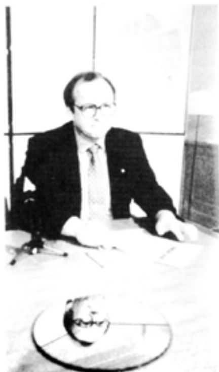
Ingen har haft så koncentrerad makt sedan Gunnar Sträng. Makten används för att återvinna positionen som världens mest skattetyngda land.

Ibland kan det ha sina fördelar att engagera en hänsynslös torped som Göran Persson. Sina främsta meriter vann han just som torped under sin tid som utbildningsminister. Sedan utbildningsminister efter utbildningsminister (borgerliga såväl som socialdemokratiska) misslyckats med att tämja den jättelika och förlamande byråkratin inom Skolöverstyrelsen (en riktigt motbjudande institution som kontrollerade skolorna i detalj och som i sin tur genomsyrades av "1968 års idéer") fick Göran Persson uppdraget som skolminister 1989. Hans lösning var att avskaffa Skolöverstyrelsen och ge samtliga anställda sparken. De inemot 1 000 byråkraternas ersattes av ett slimmat Skolverk med ungefär 300 tjänstemän. Få av dem hade haft sin gärning i Skolöverstyrelsen. Han