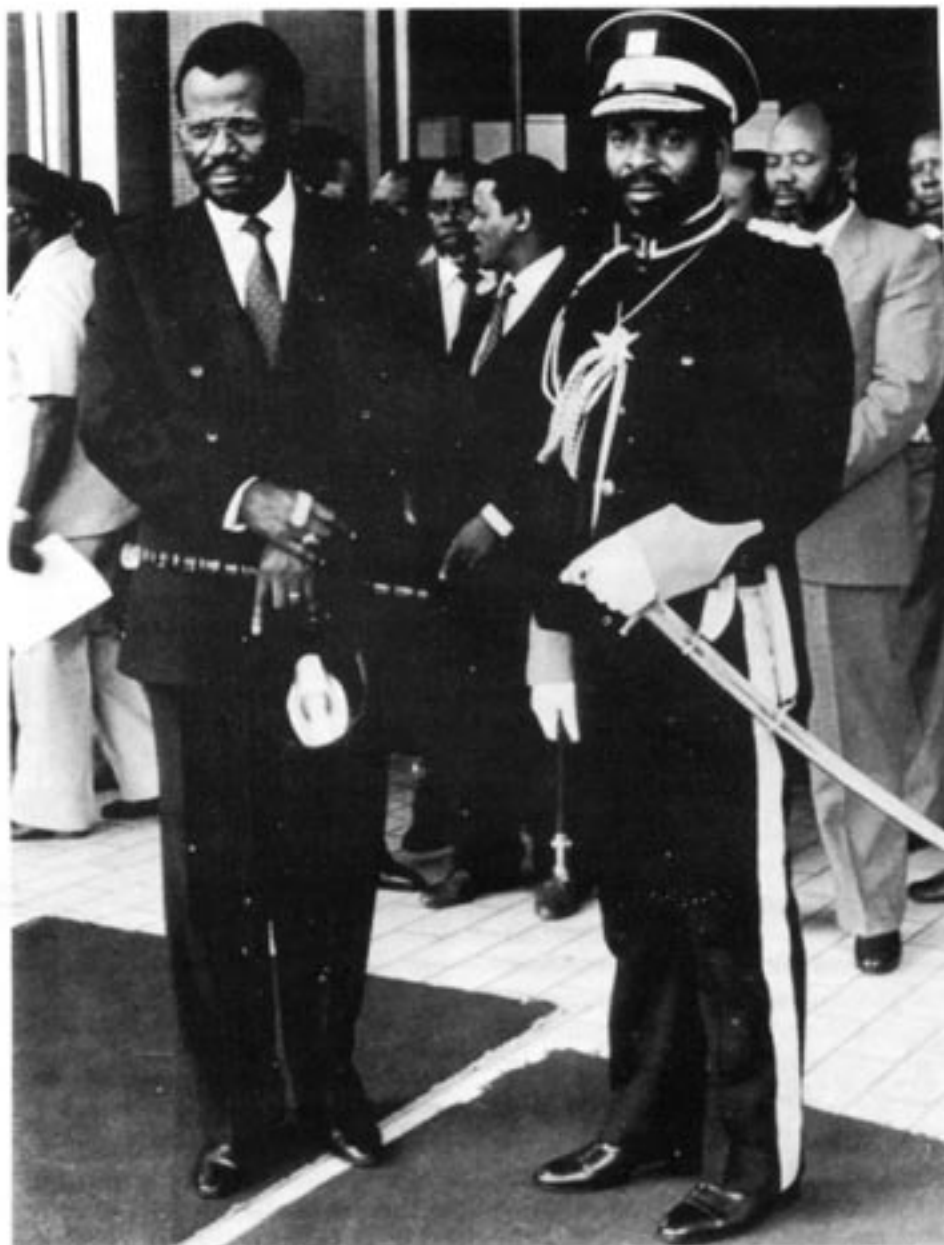
Zulurörelsens två ledargestalter i Sydafrika: kung Goodwill Zwelithini (t h) och hövding Buthelezi. För tillfället är de dock rejält i luven på varandra.

Inkhata-rörelsen och Zulu-nationen anser sig i hög grad missgynnade av det sjösatta politiska systemet. Zuluerna och dess främsta förkämpar, Buthelezi och kung Goodwill Zwelithini – de båda är för tillfället oeniga – har under lång tid krävt en egen stat under ett federalt system i provinsen Natal där Zulu-området