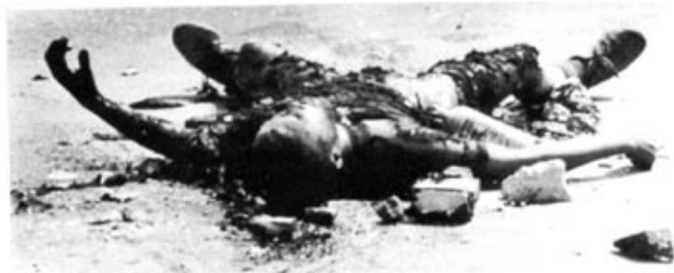
Stenad och bränd till döds av ANC – en Inkhata-anhängare i Lamontville nära Durban.

Under många år som olaglig rörelse följde ANC noggrant sin revolutionära målsättning, uppbackat av den svenska regeringen som mest frikostig biståndsgivare. Först när ANC utropade sig till politiskt parti hade den borgerliga svenska regeringen modet att dra in biståndet. ANC:s militärkommando planerade och genomförde en lång rad cyniska attacker, företreddesvis i form av tidsinställda eller fjärrut-