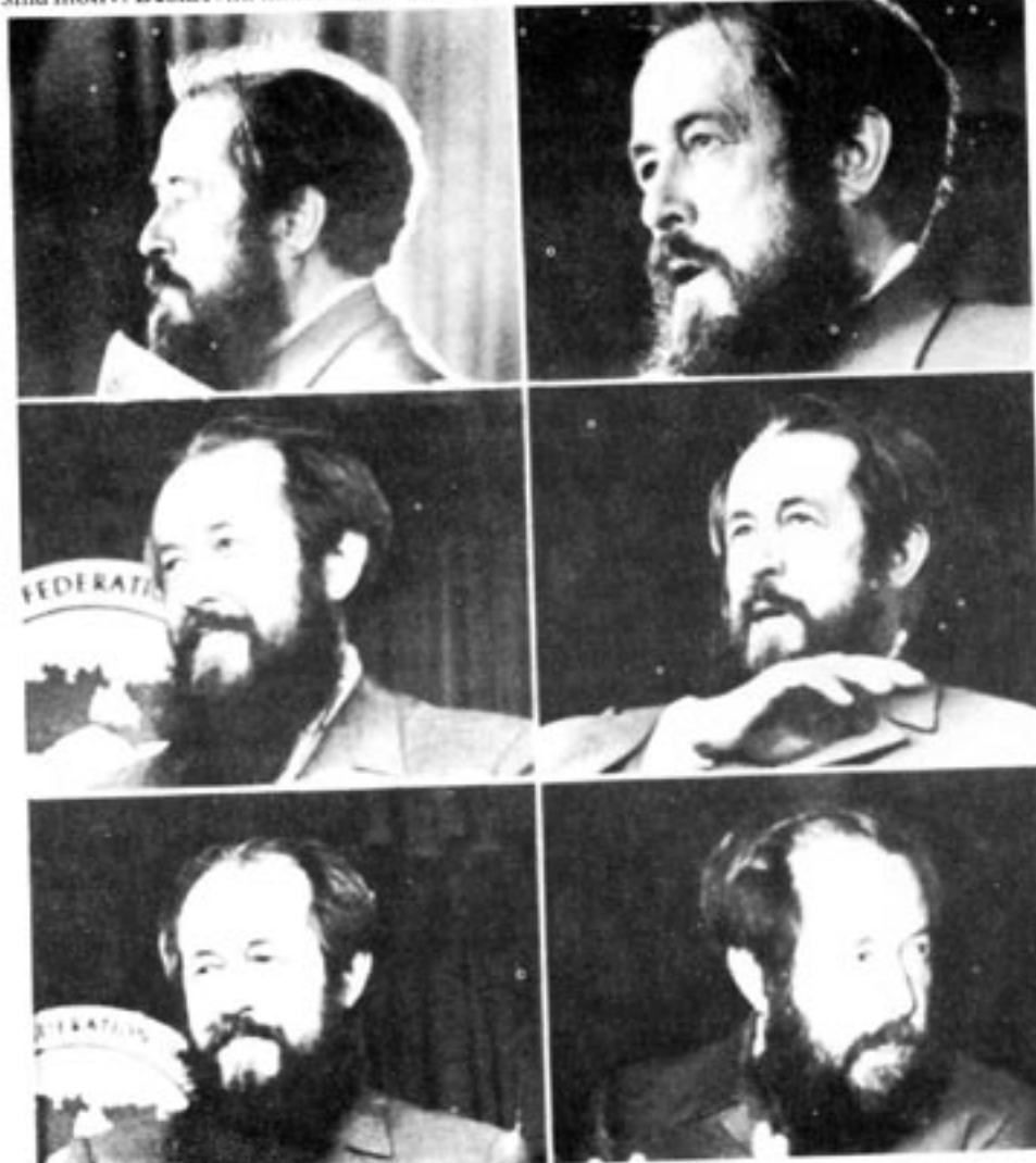
En profets ansikten...

Men trots Solzjenitsyns många gånger outhärdliga realism finns i hans produktion ändå en bakomliggande förtröstan: man får inte resignera inför det djävulska utan måste sätta sin tillit till både sig själv och en högre, gudomlig verklighet som finns djupt inne i var och en av oss. Trots sin svartsyn har Solzjenitsyn aldrig förlorat hoppet om mänsklighetens – och Rysslands – slutliga återlösning. Det faktum att den rysk-ortodoxa kyrkan under många år och decennier fungerat som ett propagandaredskap för kommuniststaten och dess förgreningar har aldrig fått honom att tvivla på religionens sanning. Människor