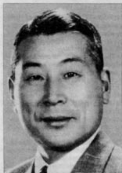
Chiune Sugihara, Vilnius' Raoul Wallenberg

våld av den ryska övermakten, men han fortsatte att skriva visa på tåget och lämnade ut dem genom fönstret. Sugihara räddade livet på flera tusen judar. Efter kriget fick han sparken från japanska UD, på grund av sin olydnad. Han försörjde sig sedan som glödlampsförsäljare. Först i år, 1994, har hans gärning uppmärksammats efter förtjänst i hemlandet.