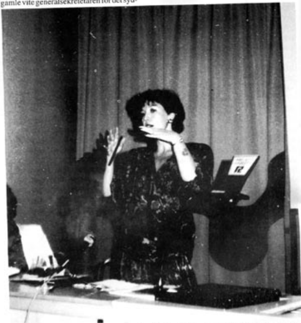
Frances Kendall, här under ett framträdande i Stockholm, förespråkade i boken "Sydafrika efter apartheid" (1987) ett federalt system av schweizisk kantonmodell.

Men om ANC är Sydafrikas största hopp – Gud bevara Sydafrika!