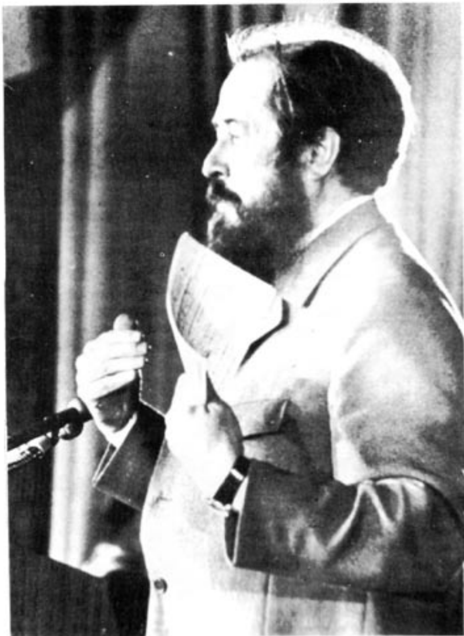
Alexander Solzjenitsyn talar inför den amerikanska fackföreningsrörelsen AFL-CIO sommaren 1975.

Alexander Isajevitj Solzjenitsyn föddes den 11 december 1918 i Kislovodsk. Han blev tidigt faderlös och uppfostrades uteslutande av sin moder. Han kom att studera fysik och matematik vid universitetet i Rostov, men blev tidigt litterärt intresserad. 1939-41 tog han en korrespondenskurs från Moskvas institut för historia, filosofi och litteratur. Men det var under sin fångenskap några år senare som Solzjenitsyn väcktes till insikt om tillvarons djupare as-