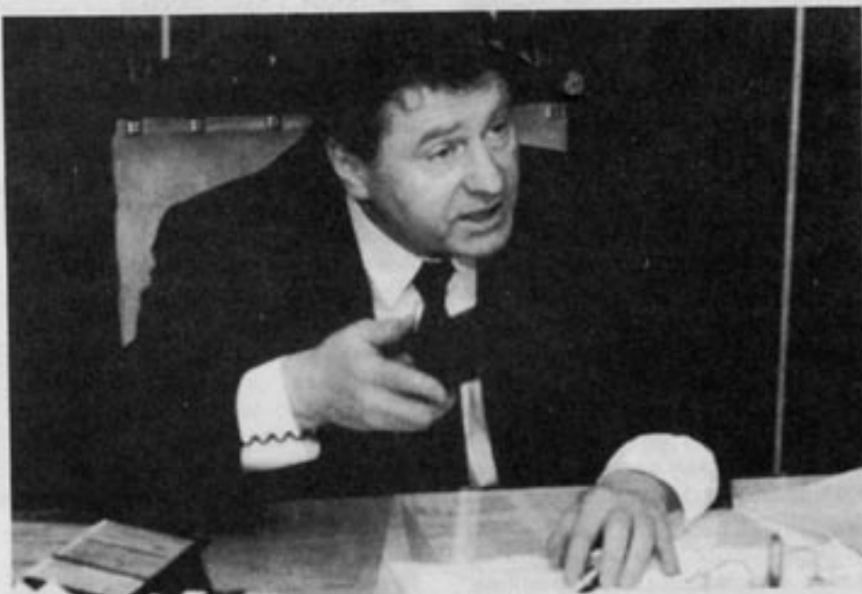
Just nu försvagas den ryska krigsmakten snabbt. Zjirinovskijs hot fjärrmar sig från verkligheten. Men hur ser det ut om fem år?

I början av 1980-talet hotade den federala regeringen i USA med att dra in alla vägsanlag till delstaterna om de inte höjde minimiåldern för inköp av alkohol till 21 år. Tidigare var åldersgränserna olika i olika delstater. Sammanlagt 43 delstater höjde minimiåldern för inköp av alkohol i början av 1980-talet. Enkätundersökningar som gjorts bland gymnasister visar att spritkonsumtionen minskade när inköpsåldern höjdes. Men konsumtionen av marijuana höjdes i just de delstater som höjde inköpsåldern. I de delstater som låg kvar på en oförändrat hög inköpsålder för alkohol noterades inga förändringar. John DiNardo och Thomas Lemieux vid National Bureau of Economic Research har gjort studien, som också konstaterade att det fanns ett