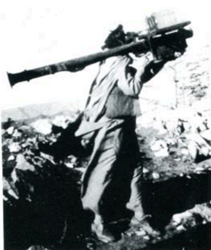
Afghanistan befriade sig från den sovjetiska ockupationsmakten. Det innebar inte att kriget tog slut. Här en afghansk kämpe från tiden för kriget mot Sovjet, med en amerikansk Stinger-robot på axeln.

Christer Arkefors C-J Charpentier: Afghanistan - landet på världens tak . Almqvist & Wiksell, Stockholm.