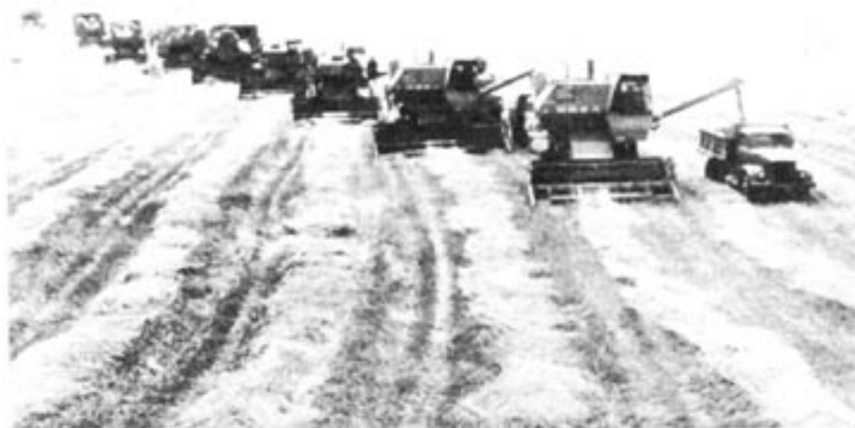
Ukraina har i sekler varit Europas kornbod. Men under Stalins tid svält miljoner ukrainska bönder ihjäl. Idag härskar planekonomin, trots marknadsekonomiska reformer i flera av de övriga f d sovjetrepublikerna.

under armarna av staten – som inte har några pengar, men som gärna trycker nya. Hela planhushållningssystemet lever kvar, med den skillnaden att många kunder och leverantörer försvunnit eftersom de ligger i andra f d sovjetrepublikerna, där de kanske tvingats till nedläggning eller ändrad produktion på grund av marknadens krav. Sådant bekymrar dock inte styresmännerna i Ukraina, som fortsätter att styra sitt luftslott efter gamla beprövade kommunistiska principer.