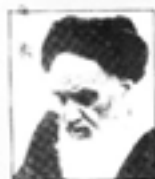
Ayatollah Khomeinis Religiösa Principer