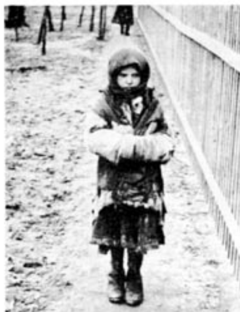
Mörka minnen från Stalinterrorn 1933. En föräldralös ukrainsk flicka i en utdöd stad. Det bördiga Ukraina var svältens boning på grund av planekonomisk terror. Än är inte planekonomin övergiven.

Ukraina var en av de tre sovjetrepublikerna som hade baser för strategiska kärnvapen. En stor del av den militära produktionen har också legat i Ukraina. Det kaos som rått i Ukraina har skapat betydande oro för vad som skulle hända med kärnvapnen. Såväl USA som Ryssland har engagerat sig hårt i frågan och en överenskommelse har nu träffats om att Ukraina ska montera ned sina 1 800 stridsspetsar och skicka dem till