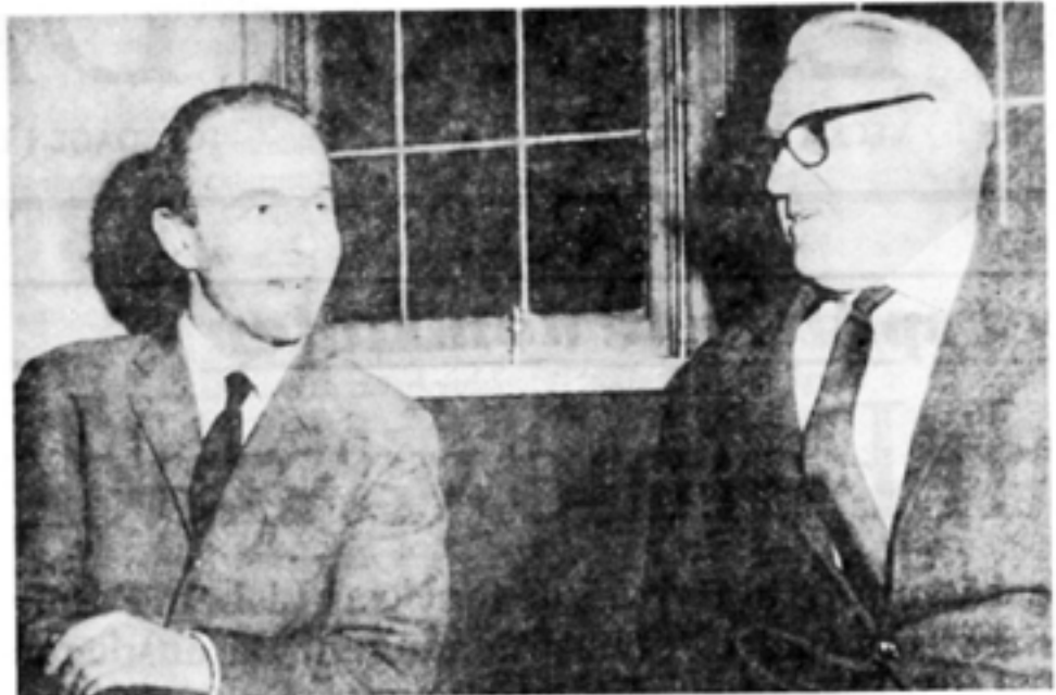
En bild från svunna tider. Stalin-beundraren C H Hermansson till vänster tillsammans med företrädaren som svensk kommunistledare, Stalin-beundraren Hilding Hagberg.