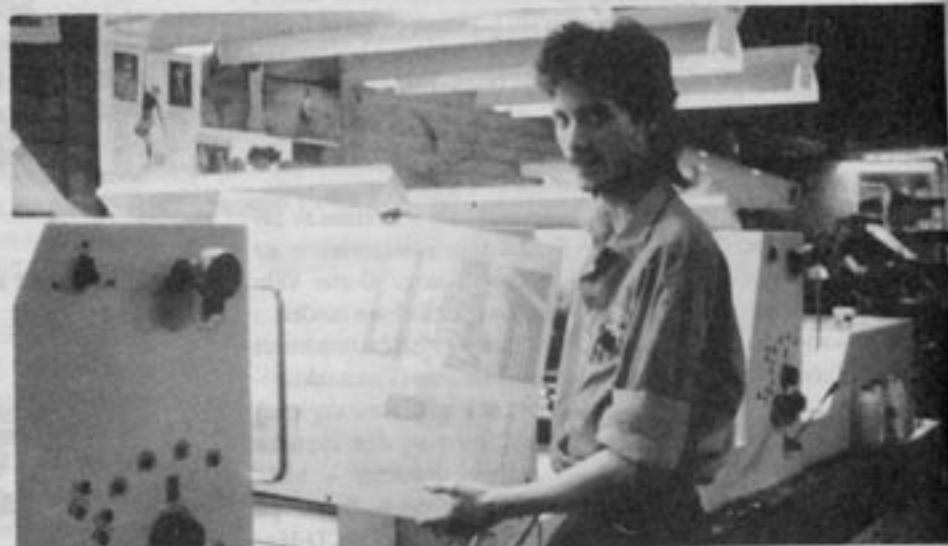
Hos tryckeriet görs på fotografisk väg tryckplåtar av de färdiga Contra-sidorna. Sedan är det dags att köra igång tryckpressen.

Kvar återstår endast kuvertering och etikettering, vilket också utförs ideellt. □