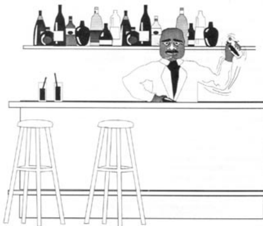
Det blev faktiskt lättare att komma över alkoholdrycker under förbudstiden. De illegala krogarna var efter ett tag fler än de barer och salooner som tvingats stänga.

Det skedde inte bara en överflyttning från svagare till starkare drycker. Dryckerna i sig blev också starkare. Såväl öl som vin och spritdrycker kom att innehålla mer alkohol än tidigare. En whiskeysort kallades