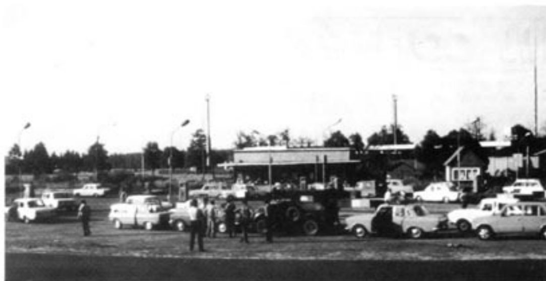
Bensinkö utanför Vladimír.