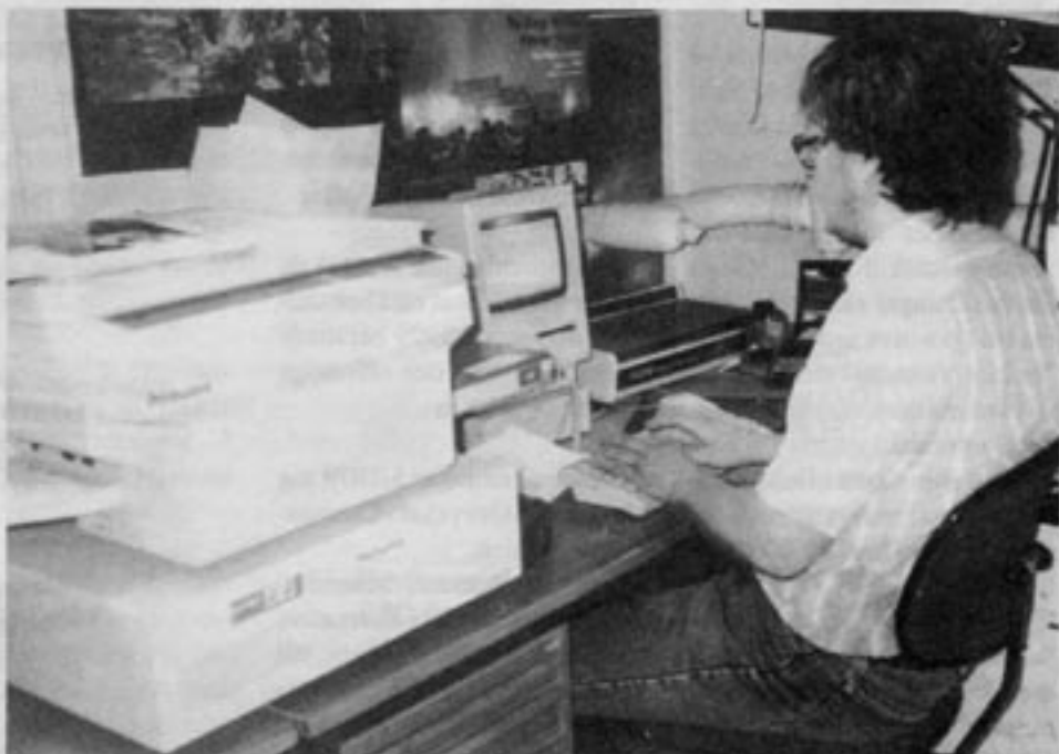
Här pågår sättning och redigering. Allt layoutarbete görs på datorskärmen, varefter de färdiga sidorna tas fram med laserskrivaren till vänster.

Men huvuddelen av det redaktionella arbetet sker under de sista tre veckorna fram