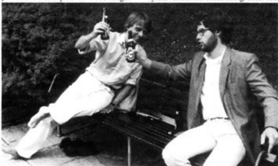
Glorifieringen av alkoholen och inställningen bland ungdomar att det är "spännande" med alkohol, är företeelser i dagens Sverige som vi känner igen från förbudstidens USA.

I stället för att tömma fängelserna fyllde alkoholförbudet dem till bristningsgränsen. I Sing Sing-fängelset ökade antalet internerade med 40 procent på tre år. Fångvårdsanstalten i Atlanta och fängelset i Leavenworth hade vardera plats för 1 500 fångar.