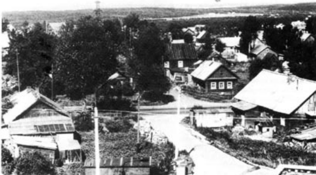
Petroskoi, augusti 1991.

Området emellan Ladoga och Onega har bebotts av karelska stammar alltsedan 800-talet. I