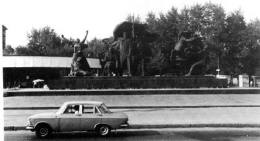
Ladabil framför ett av de många monument som hyllar kommunismen.