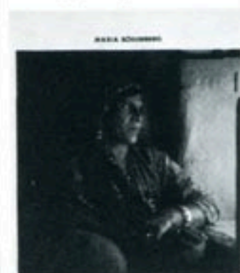
I KRIGETS SKUGGA

fällen sedan 1982. Hennes skild- ring gäller inte så mycket fasor- na vid fronten. Hon har i stället valt att skildra vardagen, kvin- norna och barnen – i synnerhet den långa kampen för överlev-