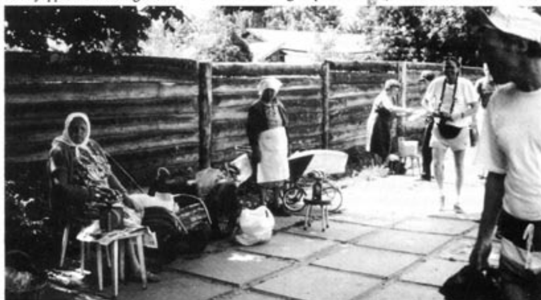
Gatuhandel i Suusdal.

Ombord på SAS-planet njuter jag av den fräscha inredningen, av maten och kaffet. □