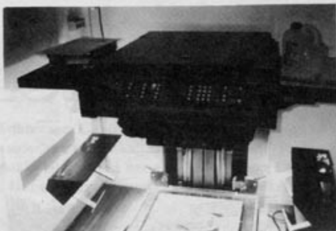
Med reprojekameran görs rasterade kopior, i valfri storlek, av de bilder som ska vara med i tidningen.