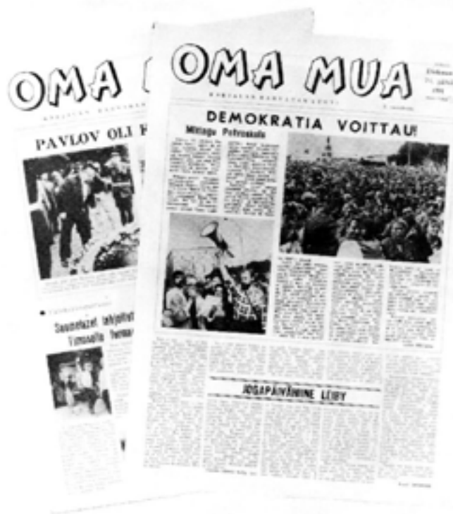
Nu kan karelerna ge ut en egen tidning; 'Eget land'. På första sidan från den 24 augusti i år förkunnas: Demokratien har segrat!