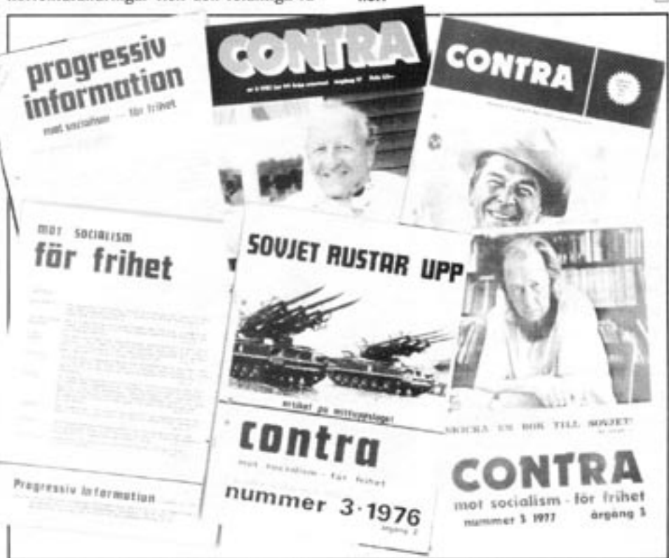
Contra genom åren. Från stencilen "Progressiv information" till dagens Contra.

Men för närvarande saknas ekonomiska förutsättningar för att realisera sådana planer. □