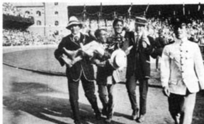
Marathonmästaren Kenneth McArthur hyllades av sydafrikanska landsmän i Stockholms stadion 1912.

föreningen ansett att det ej varit av nöden att tillfråga vare sig svenska UD eller Riksidrottsförbundet (RF) i ärendet. Tävligen hölls nämligen till övervägande del i finska vattendrag. – Nej, vi tycker inte att vi har haft någon anledning till det,