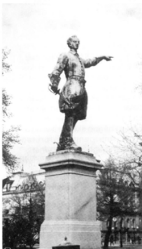
Att avfyras en kryssningsrobot från en ubåt i Atlanten och få den att träffa (för att ta ett oskyldigt mål) Karl XII-statyn i Kungsträdgården är tekniskt genomförbart och förhållandevis billigt.

USA kan visserligen med hjälp av satellitspaning upprätta sådana för i stort sett hela jordklotet, men ett fattigt land i Tredje världen kan det inte. Genom att använda sig av navigationssatelliterna blir kryssningsrobotar överkomliga även för fattiga länder. Prov med Navstar har visat att systemet gör det möjligt att fastställa en position med 12 meters felmarginal.