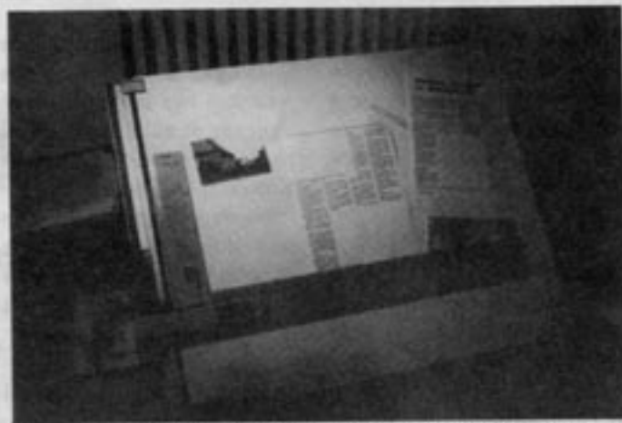
De reproducerade bilderna monteras in på de färdiga textsidorna. Som "klister" används ett specialvax, avsett för ändamålet.

bilder som senare ska monteras in. Ibland kanske en teckning passar bättre som illustration än ett foto, eller också saknas lämpligt foto. Vi har då tillgång till ett tusental teckningar på diskett. På "gula sidorna" gäller Bertil Lindbloms skämtteckningar.