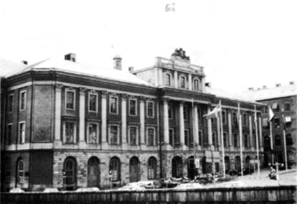
I Sverige har det socialdemokratiska partiet utnyttjat sin maktställning genom att utnämna okvalificerade personer till höga poster inom utrikesförvaltningen.

Hon skriver: "När nordiska rådet invaderade ambassaden hade jag ett intryck av att vi uteslutande var ett slags restaurang eller en sällskapsklubb med förträfflig bar, en något så när välbevarad värdinna och en ambassadör med glimten i ögat (...)