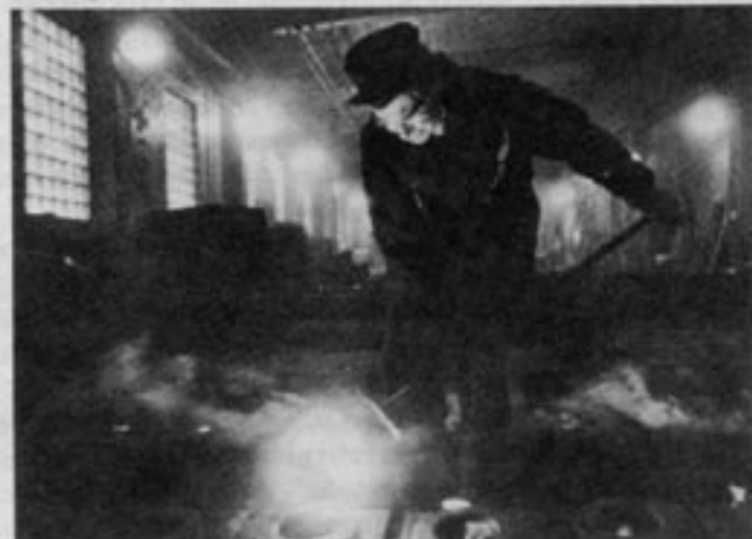
Filmen Gjutaren sågs på bio av totalt 88 personer...

Svenska biografier betalar tio procent av sina biljettintäkter till Filminstitutet. Detta enligt en "frivillig överenskommelse"