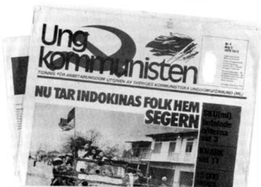
I vänsterpropagandisternas ögon var Vietnamkriget en fråga om amerikansk aggression och imperialism mot det "kämpande vietnamesiska folket"...

Skillnaderna mellan Korea och Vietnam var flera. För det första fanns inte FN med som krigförande part i Vietnam. För det andra var USAs ställning internationellt svagare under Vietnamkriget. För det tredje fanns i hela västvärlden på 1960-talet en utbredd vänsteropinion som inte på långa vägar var lika inflytelserik i början av 1950-talet. Dessa faktorer, plus USAs strategiska missgrepp under Johnson- och Nixon-administrationerna, gjorde att USA