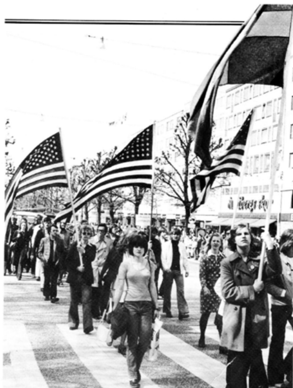
Den 6 maj 1972 hölls i Göteborg en demonstration i Demokratisk Allians regi mot Hanois försök att införa en kommunistisk diktatur i Sydvietnam.

"Förståelsen grep dem att vad de hade trott på som en hjältemodig kamp för oberoende, av samma slag som de historiska striderna mot kineserna, från början hade manipulerats av en lömsk omänsklighets arkitekter, vida värre än de utländska förtryckarnas styre mot vilket de öst sin galla — — — Vi (och med detta menade jag det vietnamesiska folket) hade kämpat storartat mot våra fiender utifrån, men vi hade varit maktlösa att skydda oss själva från den inre fienden."