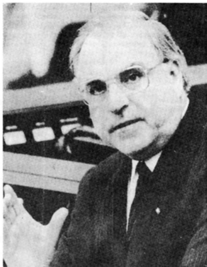
1 500 personer ägnade sig åt telefonavlyssning. Stasi hade t o m lyckats avlyssna förbundskansler Helmut Kohls telefon.

Stasi ordnade lägenheter, nya namn och nya arbeten. Världens mest beryktade terrorist, venezolanen Ramirez Illich Sanchez, Carlos, fick också generös hjälp att åka in och ut ur landet av Stasi. När hela Västtyskland mobiliserades för terroristjakt slus-