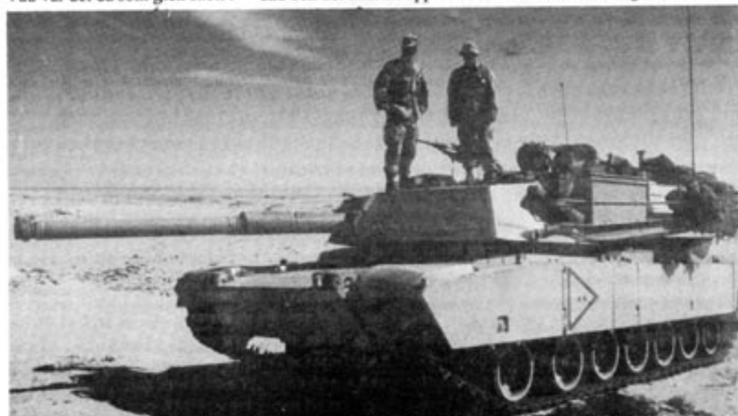
Både i Vietnam och i Persiska viken ingrep USA för att skydda små, utsatta allierade från väpnade aggressioner: från Nordvietnam respektive Irak.

Att säkra freden och stabiliteten och lösa alla konflikter i mellanöstern kan dock visa sig bli betydligt svårare än att knäcka Iraks krigsmakt. □