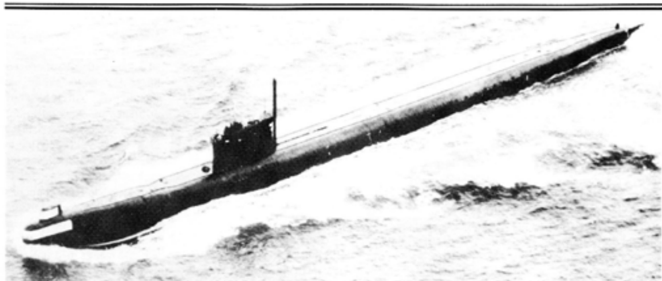
1988 skrotade Sovjet 74 fartyg ur Ishavsflottan – alla omoderna och utrangerade. Samma år och 1989 förtärktes Ishavsflottan med ett hangarfartyg, en kärnvapenbestyckad kryssare, fyra jagare och sju atomdrivna ubåtar, därav två i Typhoonklassen.

syn från USA och NATO. Hemlighetsmakandet avslöjades emellertid av kommunistpartiets egen tidning Sovjetskaja Rossija , som i en artikel hyllade militären för dess framsynthet: "Genom att på detta sätt bevara stridsvagnarna i malpåse i stället för att skrota dem kan de snabbt återföras till Centraleuropa om en krigssituation skulle uppstå".