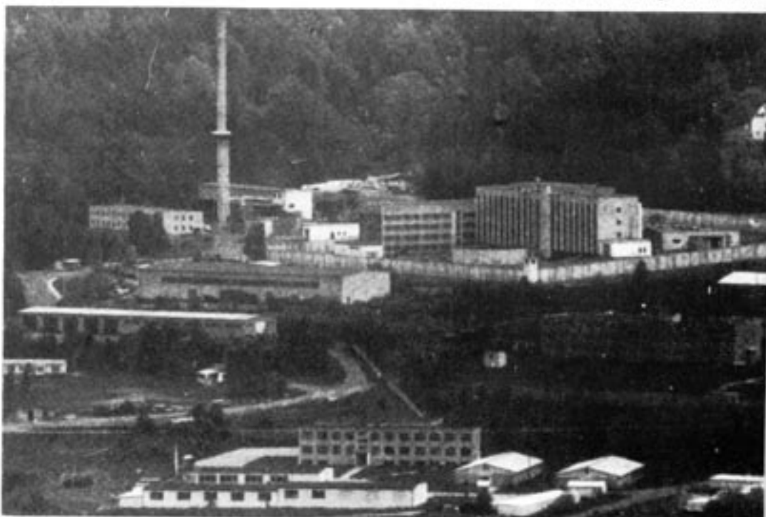
I Suhl i Thüringer Wald höll Stasi på att bygga en enorm "korrektionsanstalt". Men anstalten hann aldrig bli färdig. Östtysklands fall kom emellan.

Metoderna att vinna nya spioner var de vanliga: Från tonår-