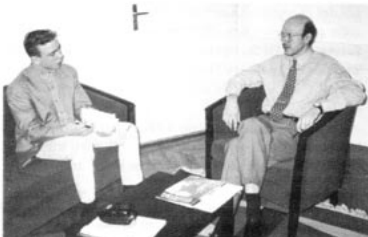
Lettlands regerings talesman Imants Gross intervjuas av Contras praktikant Carl-Johan Hardt.

den 3 mars, då hela 76 procent röstade för ett fritt Lettland. Deltagandet var därtill mycket högt, omkring 90 procent.