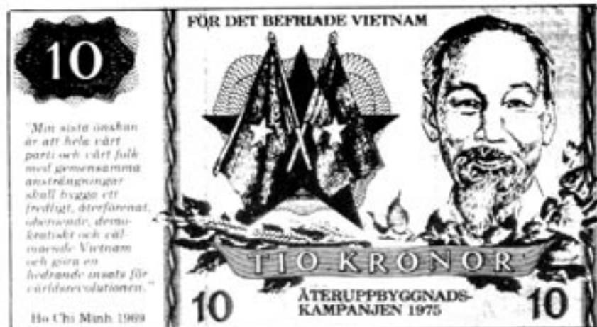
Ho Chi Minh – vänsterns stora idol. Här porträtterad på KFML(r)s "solidaritets"ta, som 1975 såldes "till förmån för Vietnams återuppbyggnad".