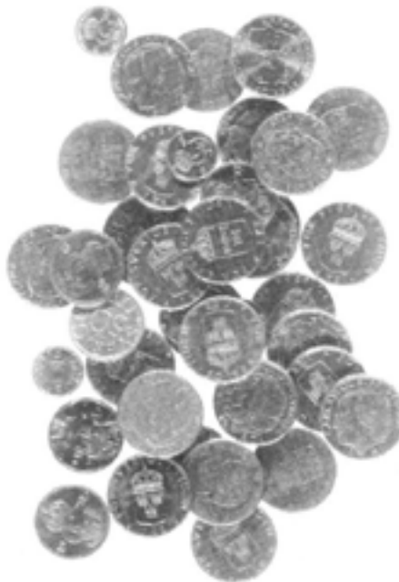
Finansmarknaden ser till att pengar sätts in där de bäst gör nytta.

ber och december, men har sannolikt alltför mycket pengar i kassakistan under första halvåret. Då kan pengarna göra bättre nytta hos den som tillverkar gräsklippare. Det här är också något som ordnas av finansmarknaderna.