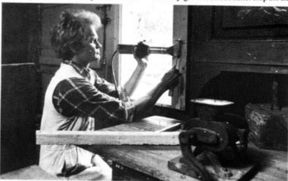
Danska löntagare som vägrar att vara medlem i en socialistisk fackförening riskerar att förlora sina arbeten.

– Detta är deras brott. Enligt den danska grundlagen har de rätt att gå ur, och samma rätt ger dem FN:s deklaration om mänskliga rättigheter. Ändå förföljs de av i Dan-