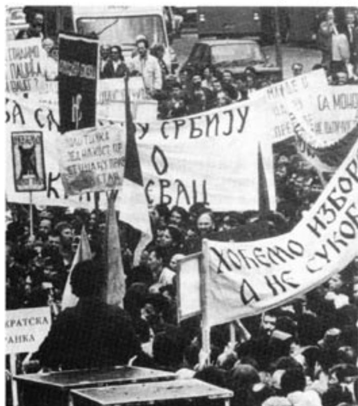
Jugoslavien är en konstlad skapelse som är på väg tillbaka till sina naturliga delar.

Som ett minne av det turkiska herraväldet på Balkanhalvön finns en stark muslimsk grupp i Bosnien. Den organiserade sitt eget