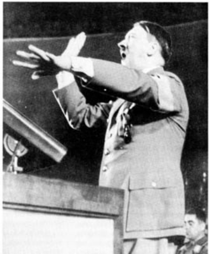
Den sovjetiska organisationen Pamjat högtidlighöll förra året Hitlers födelsedag genom att uppträda i svarta uniformer.

I en uppmärksam artikel i Pravda den 22 juli 1990 var- nades för de nya antisemitiska stämningarna, och det är ett