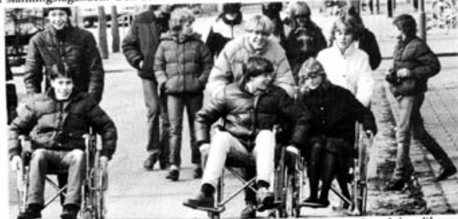
KdS betonar vikten av en fungerande social omsorg, att sjuka, gamla och handikappade tas om hand.

Det finns anledning att se fram emot en reviderad version av programmet, som mer ligger i linje med de frihetstankar som kommer fram i Idémanifest för 90-talet . □