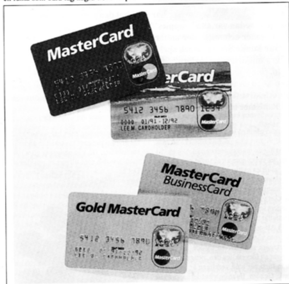
När finansmarknaden avreglerades var bankirerna inte mogna att inse vilka risker de tog när de lånade ut pengar. Det höll så länge konjunkturen bar.

Det höll så länge konjunkturen bar och priserna gick upp. Sedan kom kraschen. Och återigen reagerade de nyligen avreglerade bankerna utan det ansvar som vi borde förvänta oss i en marknadsekonomi