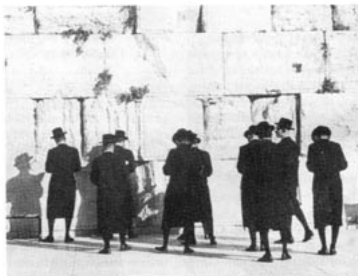
Sju av tio judar som emigrerat från Sovjet till Israel uppger i en undersökning att de utsatts för trakasserier.

Länge ville inte världsoptionen i stort höra talas om dålig be-