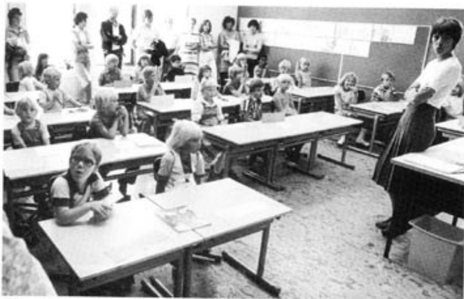
KdS vill ge fria skolor samma ekonomiska villkor som den allmänna skolan.

mycket noga med att betona sitt avståndstagande både från låt-gå-liberalism och från kollektivism. "Frihetsbegreppet får inte uppfattas som om det handlar om att skapa svängrum för den starke så att han kan roffa åt sig mer", heter det i idémanifestet med en retorik som kunde vara lånad från sextiotalsvänsterns pamfletter.