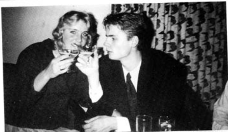
Får KdS bestämma kommer svensken inte heller i framtiden att kunna ta sig ett glas utan att ruinera sig. Inköpsbegränsningar och höjda alkoholskatter finns med på programmet.

Varje politiskt parti med anspråk på att vara seriöst håller sig med ett åsiktspaket som täcker in en lång rad frågor, alltifrån grundläggande ideologiska frågor till mer kuriösa ställningstaganden. Och det bör fram-