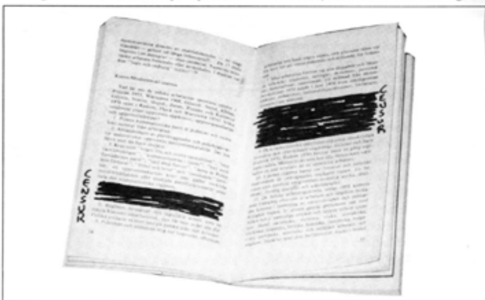
Det finns egentligen inte någon principiell skillnad mellan att censurera böcker och film

godkänna sådana framställningar som kan verka förråande . Uppenbarligen anses den svenska medborgaren härvidlag vara extra lämpbar, eftersom inslag som dansken, engelsmannen eller amerikanen får se, tydligen betraktas som mycket skadliga för svensken. (Motsvarande resonemang kan