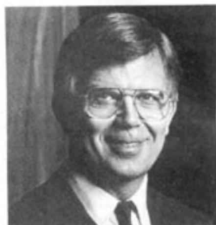
Alf Svensson är den svenske partiledare som innehaft partiledarposten längst.

nifestet påpekanen som är författade med förnuft och eftertanke. KdS betonar vikten av en aktiv miljöpolitik, men betonar med önskvärd tydlighet att "det inte går att sätta människovärdet i motsats till bevarande av de ekologiska systemen", en markering emot den extrema miljöfundamentalismen, som likställer värdet av människoliv med värdet av annat liv.