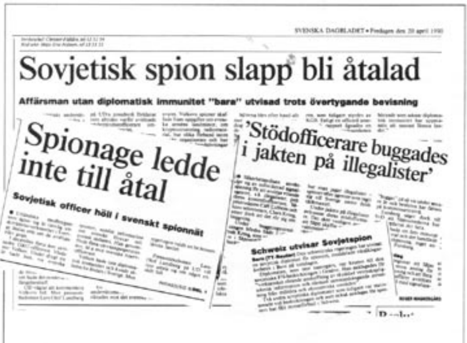
Tidningsutklipp – från i år – visar att Sovjetunionens spionverksamhet alltjämt fortgår.

GRU har sin egen utbildningsväg med egna högskolor vid sidan av den ordinarie militära utbildningen, egna truppförband, egen generalstab och egen överbefälhava-re. Högkvarteret ligger som sig bör i Mos-kva, i anslutning till den gamla flygplat-sen Chodinka. Här finns förutom GRU Flygvapnets militärakademi, Institutet för flygforskning, och andra militära institu-