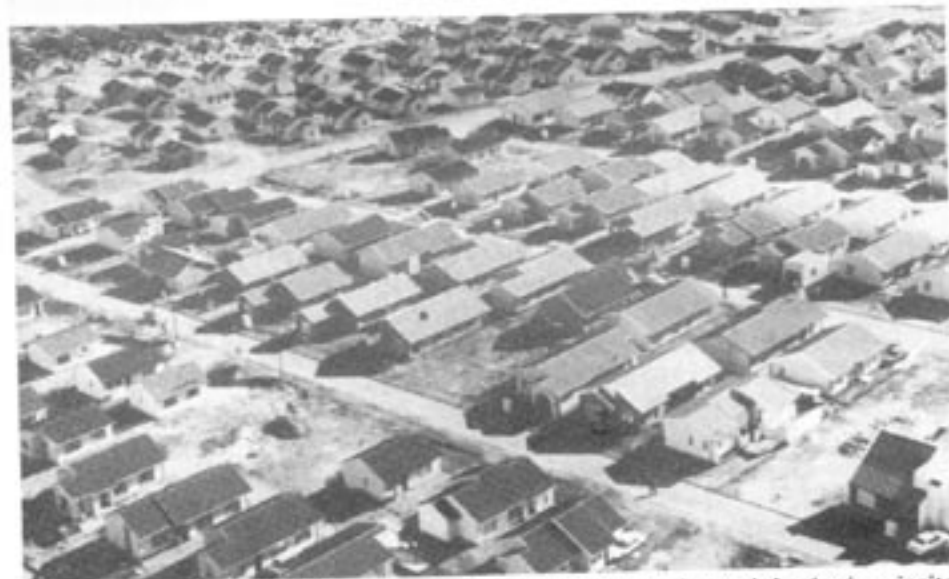
Många stadsdelar i Sydafrikas storstäder är integrerade, ofta med de vita i majoritet. Detta är en följd av marknadskrafternas spel: överskott på bostäder i de vita områdena och underskott i de svarta.

Denna fientlighet mot kapitalismen är inte att förvåna när vi betänker att det vita