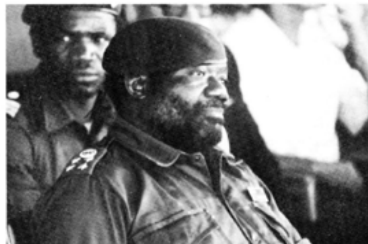
Mandela flirtar med Fidel Castro och Yassir Arafat men motsätter sig USAs stöd till Jonas Savimbi.