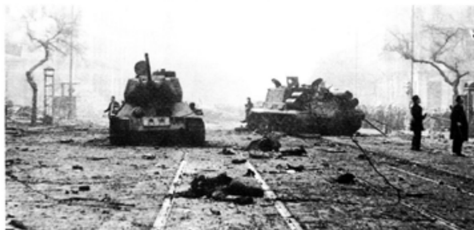
Marx' lära har krävt ofantligt många människooffer. Som här i Budapest 1956.

Hegels storslagna världsbild inspirerades av den franska revolutionen. Med tiden blev