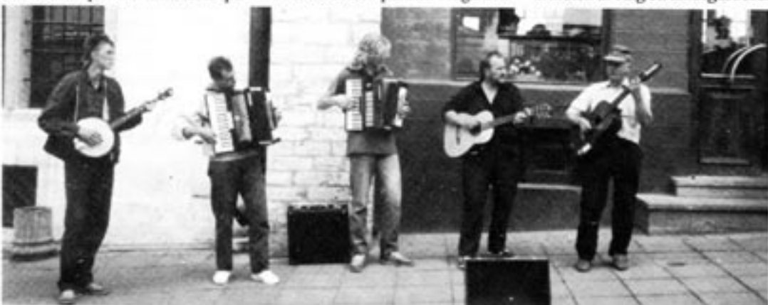
Fem gatumusikanter spelar och sjunger välkända estniska folkmelodier, men texterna är nya och laddade med aktuell politik.

När de fått dessa operationsytor börjar uppröjningsarbetet. Det kan ta tid det också. Men har man väntat på friheten så länge som esterna är det mer sannolikt att det skulle bli en explosion i välstånd. Och det är inte då, när de har fått friheten, som vi på gammalt bussigt svenskt manér behöver komma till undsättning och skeppa över mikroågsugnar och videoapparater. Det är nu, genom att arbeta för deras frihet och självständighet, som vi ska hjälpa dem att få förutsättningar att skapa dessa saker själva. Ty friheten är i sig ett smörgåsbord.