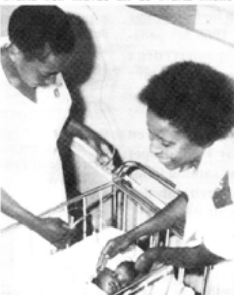
Sydafrikas apartheid är inte en följd av kapitalismen, utan av socialistiska försök att eliminera marknadskrafterna.

Sydafrikas angrepp på marknadskrafterna omfattade lagar som fått kraftigt stöd av vänstern också i USA. Anhängarna av vit överhöghet krävde minimilöner för de svarta och krävde att de svarta skulle