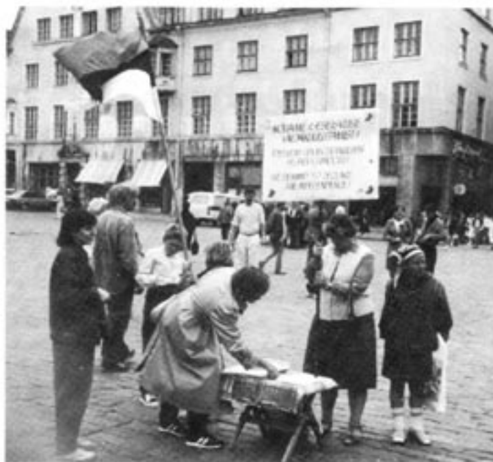
På Rådhusplatsen står en representant för Estlands demokratiska union.

Bilderna från gatan, där esterna sjunger ut sitt rop på hjälp,