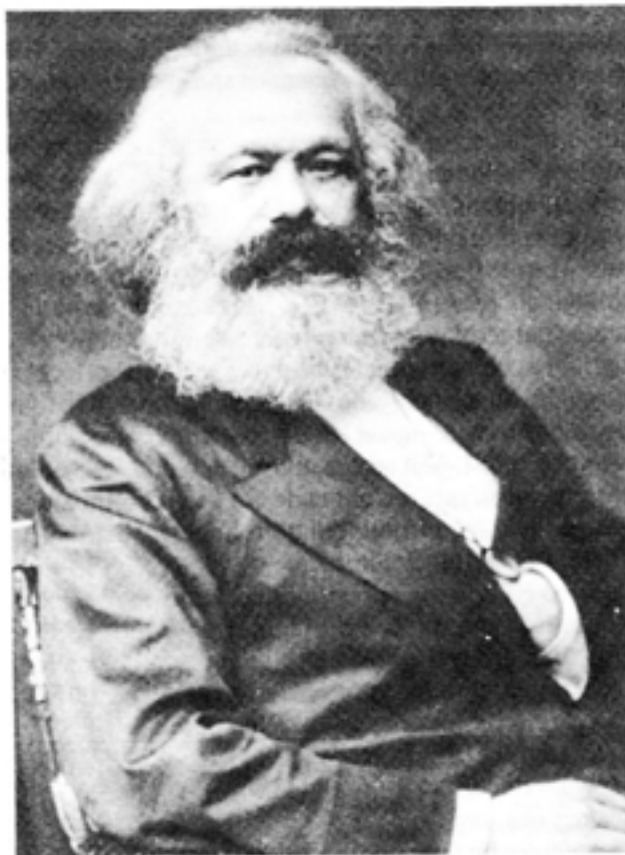
Marx levde som en borgerlig husfader och predikade sitt omstörtande evangelium, bekvämt tillbakalutad vid sitt skrivbord.

Men det finns olikheter – medan Jesus under svåra umbäranden går ut bland folket med sitt evangelium och visar prov på ett personligt mod, en heroism som inte är av denna världen, och utan tvekan begår det religiösa människoeffret, sitter Karl Marx – låt vara landsflyktig och