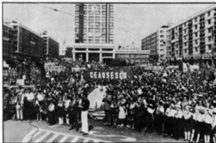
VPK hade goda kontakter med Ceausescu. Den 19 november 1989 – en månad innan Ceausescus störtades – sände VPK välgångsönskningar till det rumänska kommunistpartiets kongress...

I och med att C H Hermansson blev partiledare 1964 påstod VPK sig ha slutat dansa efter