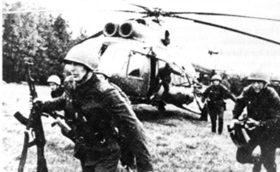
Om väst som en följd av glasnost och perestrojka rustar ned – då finns ingenting som hindrar ryssarna från att förvandla hela Europa till en sovjetisk satellit.

Michail Gorbatjovs omvandlingspolitik i Sovjetunionen, som fått sådana långtgående konsekvenser för hela östblocket, har två ansikten, anser John Gray – ett utrikespo-