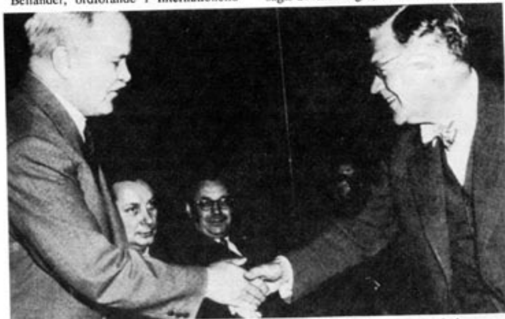
Östen Undén vinnlade sig om ett positivt förhållande till Sovjetunionen. Här hälsar Undén (t h) på den sovjetiska utrikesministern Vjateslav Molotov i FN.