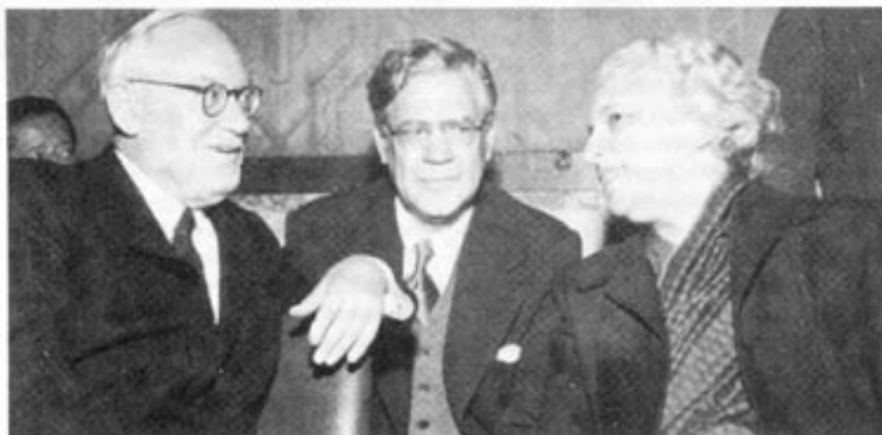
Utrikesminister Undén flankerad av Sovjets vice utrikesminister Andrej Vysjinskij och Indiens FN-ambassadör Lakshmi Pandit. Året var 1953.

Söderblom tog vidare upp ärendet med Stalin själv i juni 1946. Föga överraskande lovade diktatorn att det hela skulle klaras upp. Men i slutet av januari 1947 om-