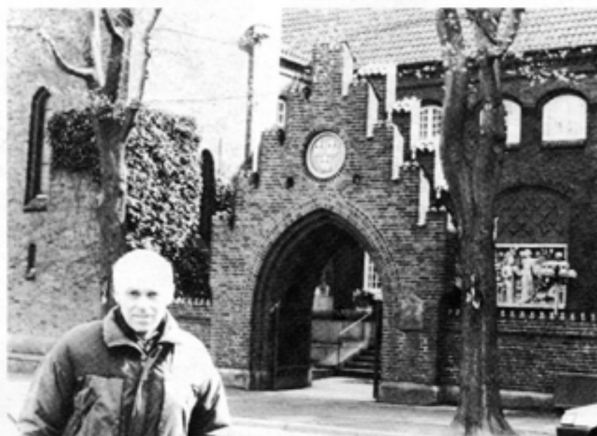
Att hålla förbön för en svensk författare är inte tillåtet i Svenska Gustafskyrkan i Köpenhamn.