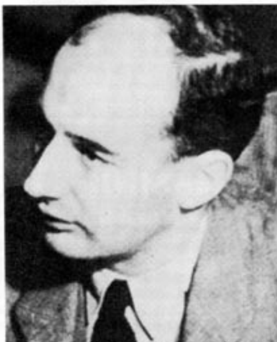
De svenska myndigheterna intog redan från början en överslättande attityd gentemot Sovjet i fråga om Raoul Wallenbergs försvinnande.

Men inte heller Sverige som ett demokratiskt västland, ehuru formellt alliansfritt, kunde undgå att påverkas av det s k "kalla kriget", som bröt ut som en följd av Sovjetunionens expansionistiska utrikespolitik, omedelbart efter det andra världskrigets slut. Det sovjetstödda, kommunistiska maktövertagandet i Tjeckoslovakien 1948 resulterade i att även sovjetvänliga svenska socialdemokrater tvingades ompröva sin