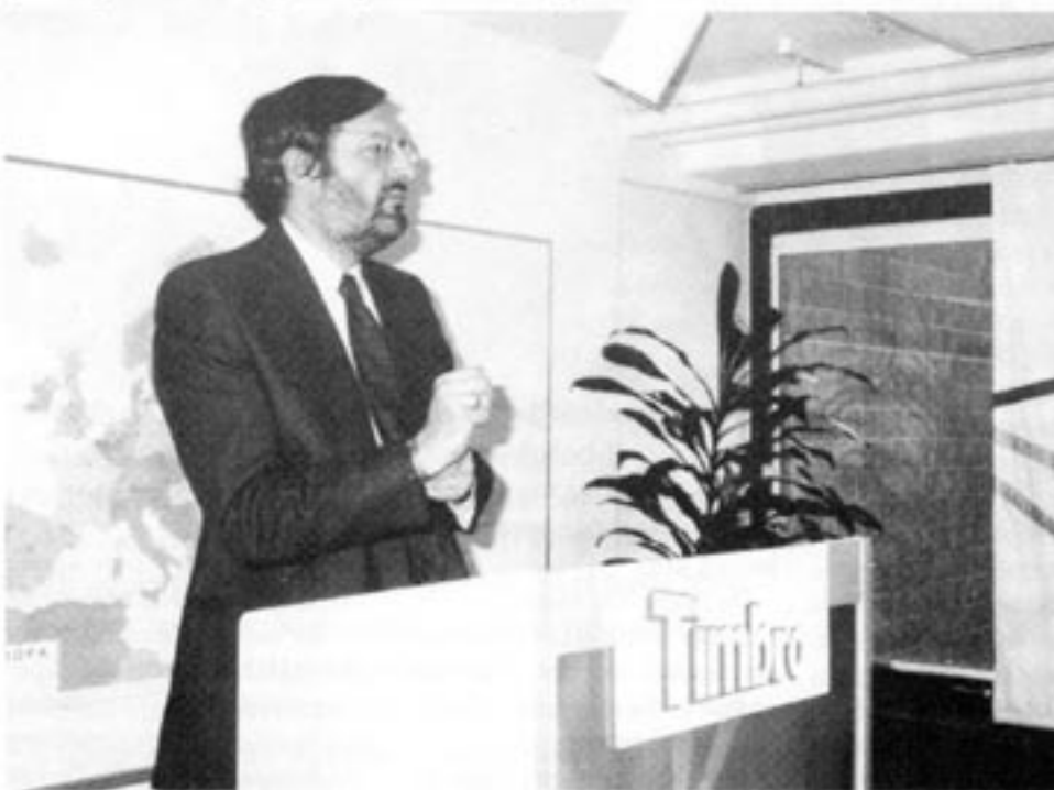
Professor John Gray, verksam i Oxford och en insiktsfull kännare av Europas politiska och ideologiska utveckling, förutser gigantiska problem för Sovjetunionen.

– Om väst vill hjälpa öst – och hjälp, om den ges på rätt sätt, är välkommen, anser