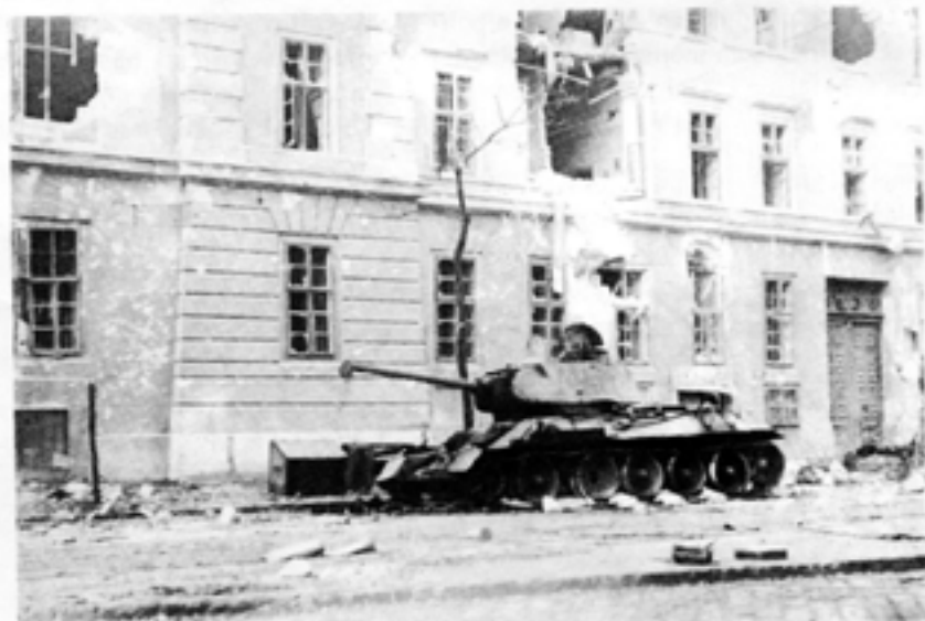
VPK sände broderliga hälsningar till det ungerska kommunistpartiet, efter det att revolten 1956 med Moskvas hjälp hade slagits ned.

Då Ceausescu höll sin sista partikongress den 19 november 1989 var VPKs hälsning lika varm som alltid: "Vänsterpartiet kommunisterna hälsar delegaterna vid rumänska kommunistpartiets 14:e kongress fruktbara överläggningar."