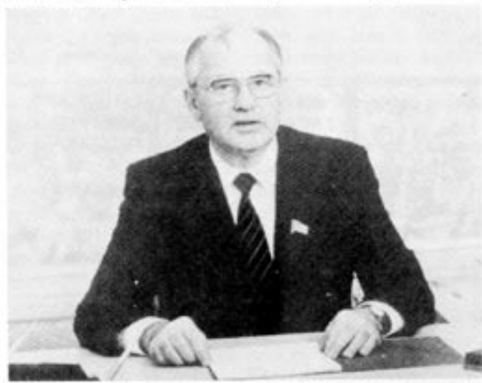
Gorbatsjov har ökat Sovjets internationella skuldsättning från 25 till 37 miljarder dollar.

nomiskt system skulle detta resultera i en galopperande inflation. I Öst har man "löst" problemet genom att hålla nere priserna och ransonera tillgången. Människor måste stå i kö för att få tillgång till de konstlat billiga varorna. I Sovjet beräknar man att 15% av den tillgängliga arbetstiden går åt till att stå