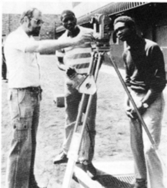
Apartheid infördes bl a för att skydda den vita arbetarklassen mot konkurrens från de svarta.

–För vita som bara var fördomsfulla gav apartheid också utbyte. De fick separata vita skolor och skattebetalarnas stöd för separata anläggningar som ett egenändamål av rena fördomsskäl. Men den stora majo-