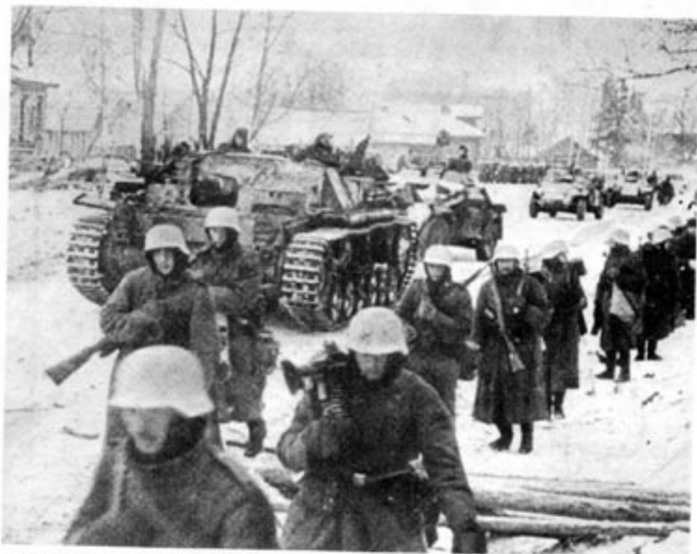
Sverige blev en frivillig medhjälpare till det nationalsocialistiska Tyskland.

Utan att överdriva kan man påstå att Sverige blev en frivillig medhjälpare till det nationalsocialistiska Tyskland. 70 procent av vår handel 1941 var med Tyskland. Det är möjligt att Sverige kunde ha förkortat kriget och sparat miljoner liv om tyskarna inte fått svensk malm. Vi vet idag att utan den svenska järnmalmen och kul-