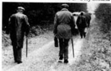
E4an från Helsingborg till Jönköping liknar vid jämförelse en europeisk byväg.