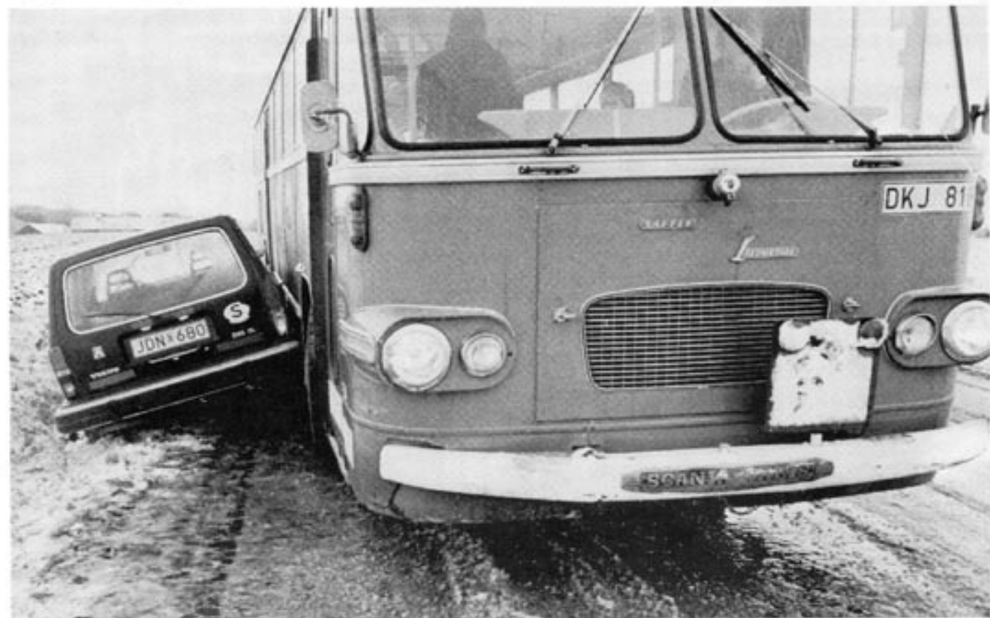
Den starke har rätt. Och de starka slåss — med hjälp av intresseorganisationer — för att skaffa sig rättigheter på andras bekostnad. Det här är ett föga uppbyggeligt spel som skapar en del av bakgrunden för det meningslösa våld som stör vårt samhälle.

De flesta vuxna i Sverige inbillar sig att produktionen är kollektiv och att det därför finns en "kaka" att fördela via politiken. De vuxna slår sig samman i intressegrupper och organisationer. Sedan kämpar de olika intressegrupperna mot varandra för att vinna kontroll över den politiska makten och använda den för att tilltvinga sig själva ekonomiska förmåner på bekostnad av de andra intressegrupperna.