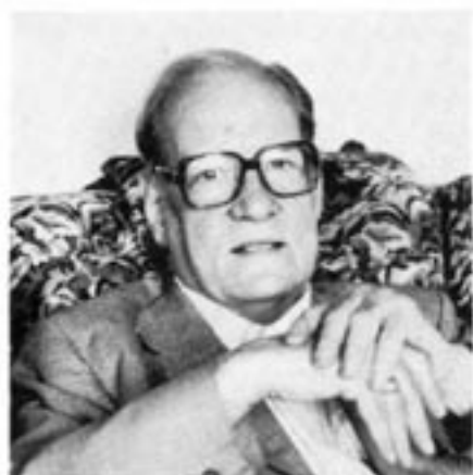
Contras frihetspris 1982 gick till författaren Sven Stolpe "för att han med stor kraft går i närkamp med marxismens frihetsfientliga krafter".