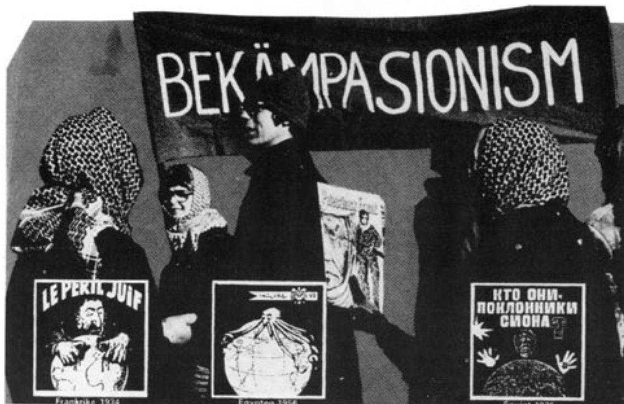
Det här bildmontaget har vi hämtat ur "Judisk krönika". Det belyser hur antisemitism och antisocialism gått hand i hand med de mest skilda ideologierna.