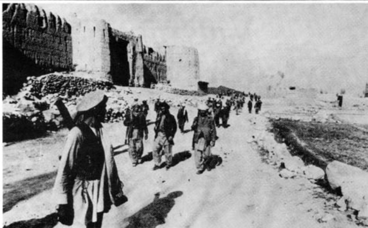
I reportaget berättas om hur sovjetiska soldater gått över till gerillan i Afghanistan. Här frihetskämpar med ett gammalt afghanskt fort i bakgrunden.

sovjetiska prostituerade som tjänstgjorde vid divisionen”.