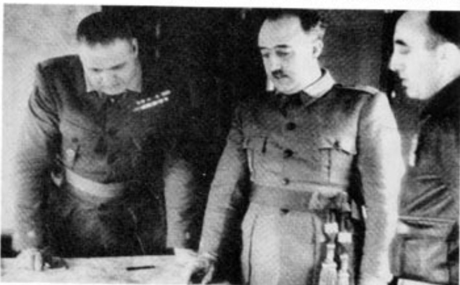
Nationalisterna gjorde uppror mot en republikansk folkfrontsregering med deltagande av kommunisterna. Nationalisternas ledare Francisco Franco resonerar här om de militära operationerna med några av sina närmaste medarbetare. Fascisterna var emellertid inte ensamma om att driva terror, den röda terrorn var lika grym.

Fascisterna ägnade sig åt terror mot civilbefolkningen när de hade erövrat städer. Men vad gjorde den andra sidan? Det fanns också en röd terror, som de vänsterintellektuella inte så gärna vill skriva om. Jag tänker på Willy Brandt, Hemingway, Müntzenberg, Orwell, Koestler och många andra. I Barcelona, där de röda hade makten, våldtogs nunnorna innan de sköts. Man skar av penisen på motståndarna och tvingade dem att äta den, skar av tungan eller öronen på dem som inte trodde på det kommunistiska budskapet. Man spikade upp präster, adel, storgodsägare, egna företagare och demokrater på trähusen, man torterade minst 30 000 människor som föll offer för den röda