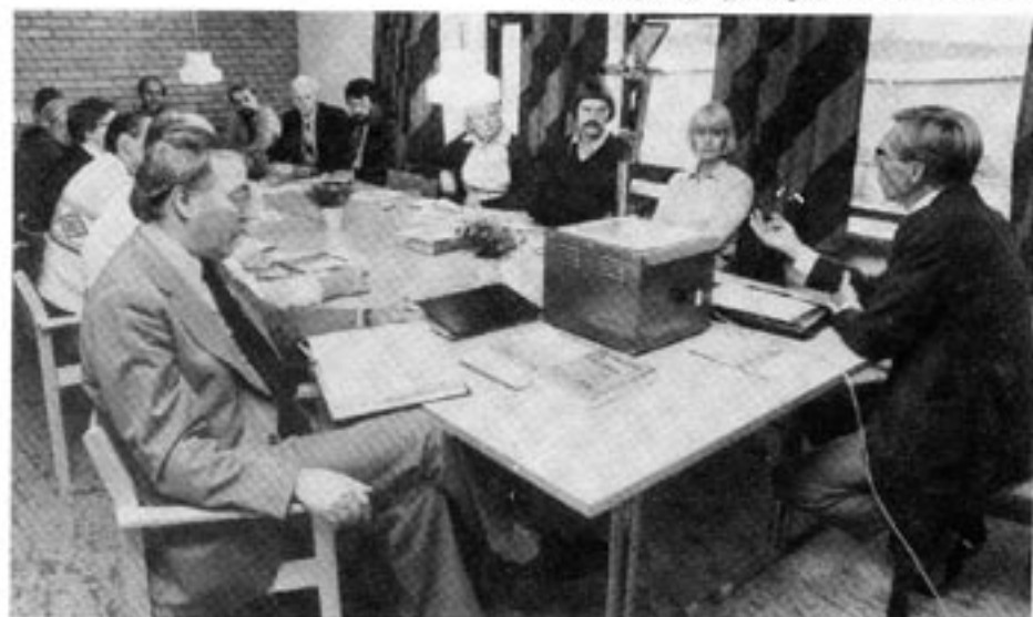
Skolan är ett av de områden där byråkratiseringen varit snabbast. Sedan den nioåriga skolan genomfördes har personalen fördubblats, samtidigt som elevantalet gått ner med 10%. Huvuddelen av personalökningen avser byråkratiska funktioner.

När utredningen ger sig i kast med att granska uppdelningen på olika verksamhetsområden mer i detalj blir utvecklingen än mer anmärkningsvärd. Centrala myndigheter, en del av förvaltningen, har under perioden ökat med 400 procent. Och de centrala myndigheterna kommer allmänheten nästan aldrig i kontakt med. Det är de myndigheterna som upplevs som kärnan i byråkratin. Myndigheter på regional eller lokal nivå