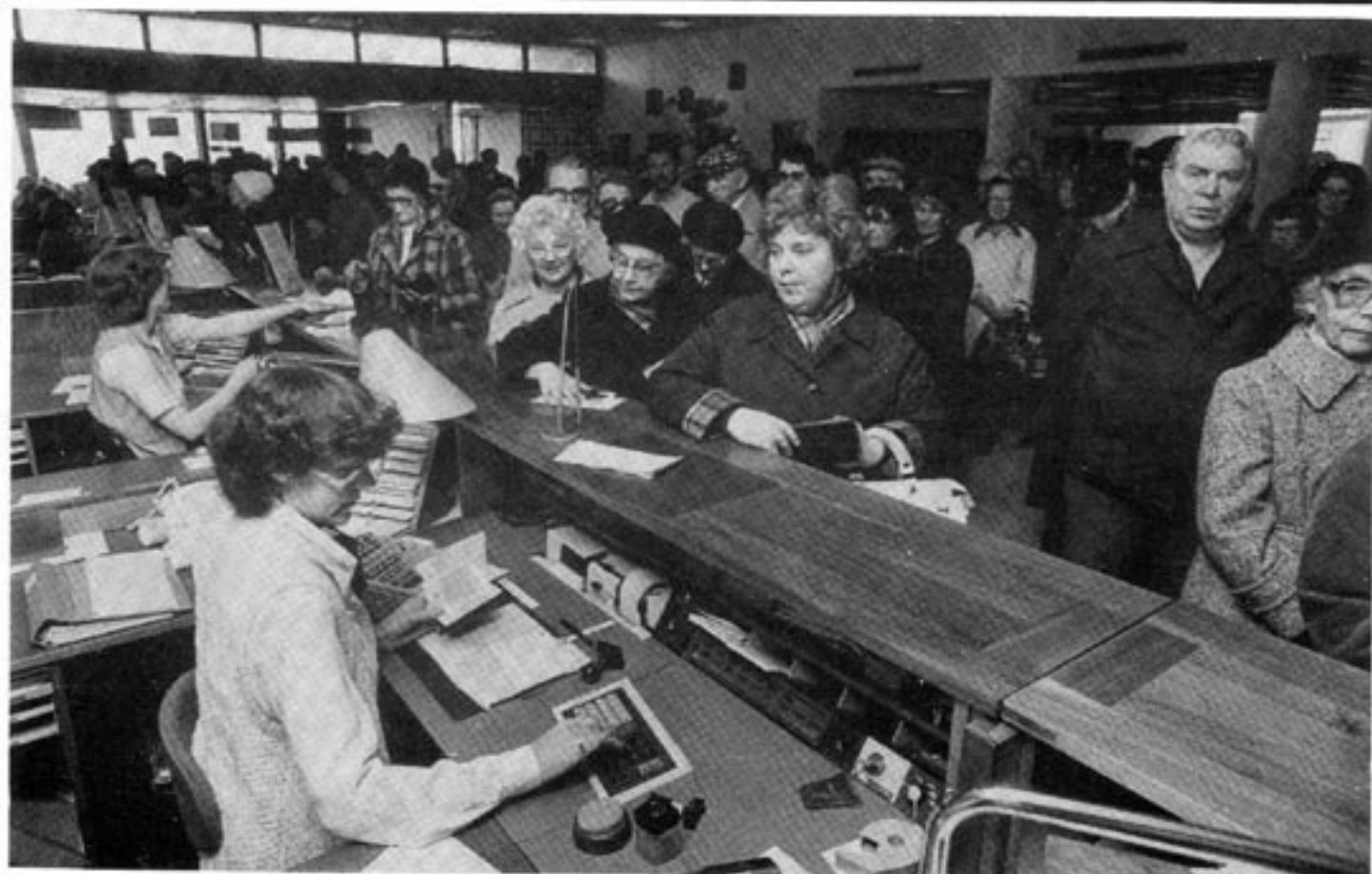
Socialliberalen instämmer helt med nyliberalen om marknadsekonomin som det effektivaste sättet att maximera samhällets produktion av varor och tjänster. Men har en annan syn på vad en rättvis fördelning av produktionsresultatet innebär.