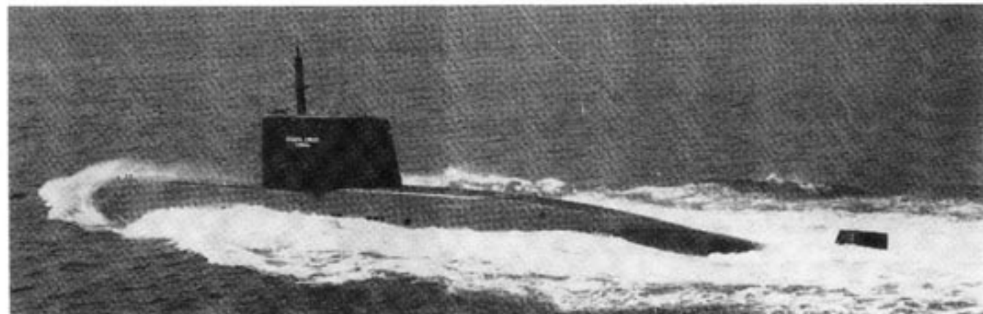
Västtyskland har nått stora exportframgångar med ubåtar. Bl a har den indiska marinen valt västtyska ubåtar

Firman Dornier , före kriget känd för sina civila flygplanskonstruktioner, har återupptagit tillverkningen av propellerplan för armén och flyget och samarbetar med det stora Industriwerke-Karlsruhe-Augsburg .