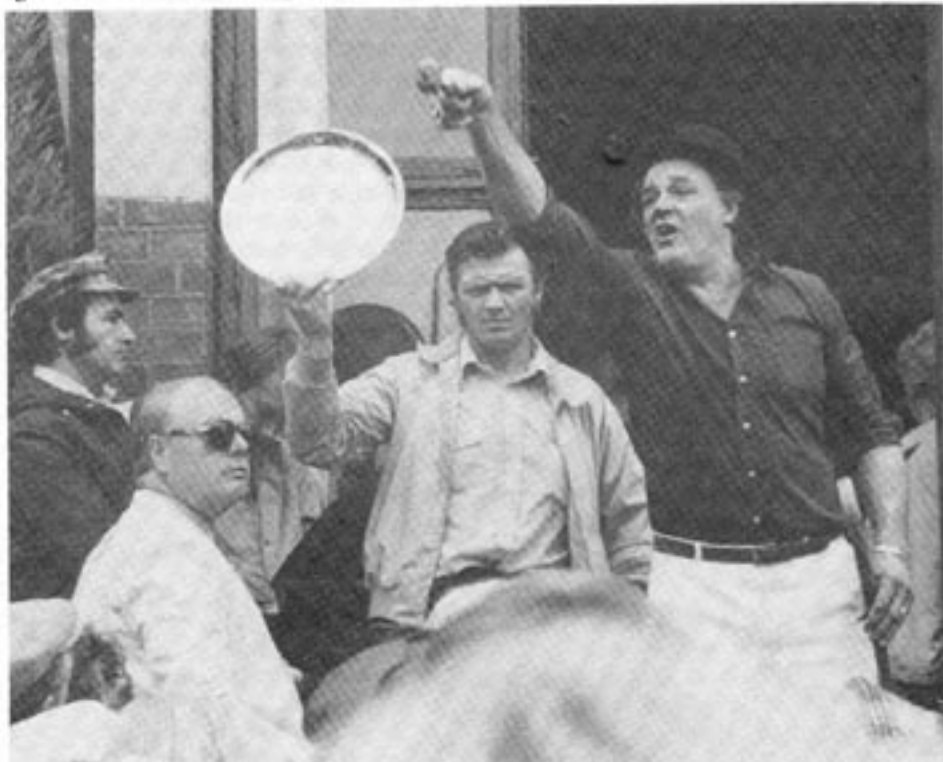
Auktionsförrättare är i stort sett de enda näringsidkare som Statens Pris- och Kartellnämnd, SPK, låtit vara ifred. Nu gör SPK också anspråk på att vara överdomare över det fria ordet.

Mot den här bakgrunden genomförde Contra en analys av tryckfrihets- och prislagstiftningen. Slutsatsen var att det enligt gängse rättsprinciper inte skulle vara möjligt att