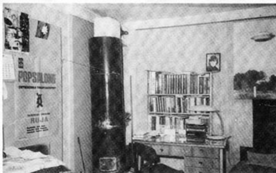
Min och min mors bostad i Tartu — ett kyffe på elva kvadratmeter.

nasium. Därefter började jag arbeta för Estlands radio, i början med barnprogram.