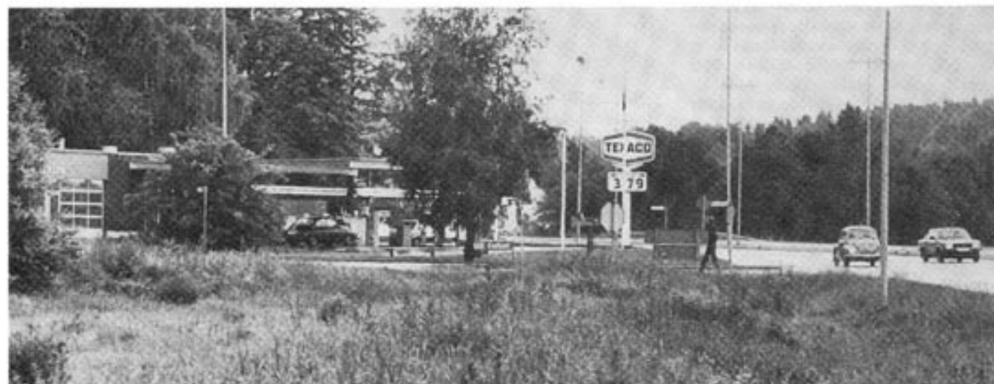
Texaco är ett av de få företagen på den svenska bensinmarknaden som arbetar på hederligt kapitalistiskt sätt. Flera av konkurrenterna är statliga eller delstatliga företag.