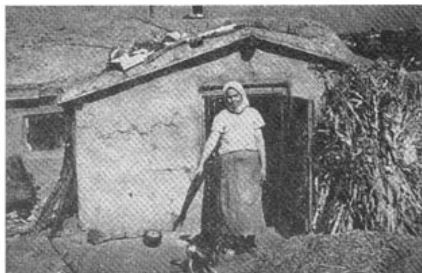
Så här kunde det se ut på landsbygden i Ukraina när UPA kämpade mot såväl nazister som kommunister för ett fritt Ukraina.

Artikeln är en något förkortad version av en artikel som publicerats i tidskriften ABN Correspondence i München. I sin nya bok "Frihetskämpar" beskriver Bertil Häggman utöver UPA också dagens antikommunistiska gerillarörelser och analyserar förutsättningarna för frihetskamp i kommunistiska länder. Boken kan rekvireras från Contra för 68:- plus porto.