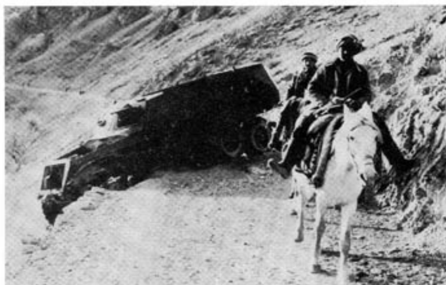
De erfarenheter som gjordes under UPAs kamp i Ukraina under 1940- och 1950-talen kan användas av dagens antikommunistiska gerilla i Afghanistan.

Idag saknas samordning och solidaritet mellan de olika upprorsgrupper som bekäm-