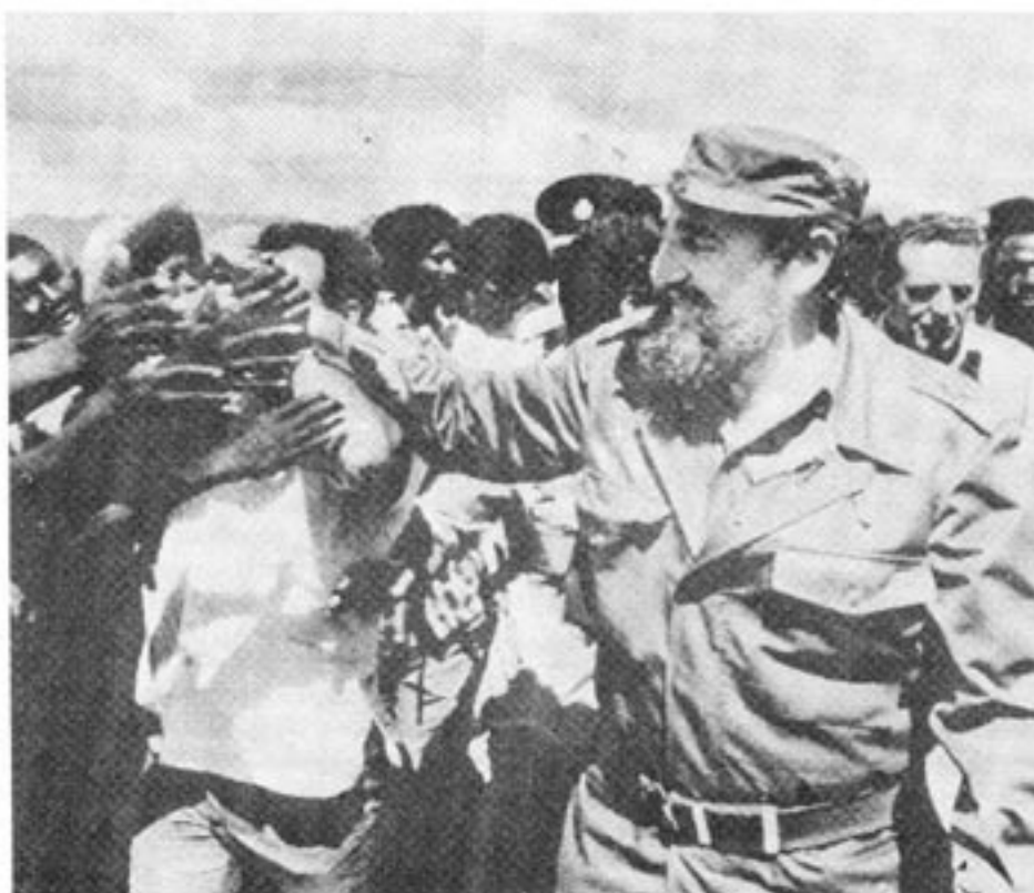
Alpha 66 arbetar — också genom väpnad verksamhet på Kuba — för att störta Fidel Castro.