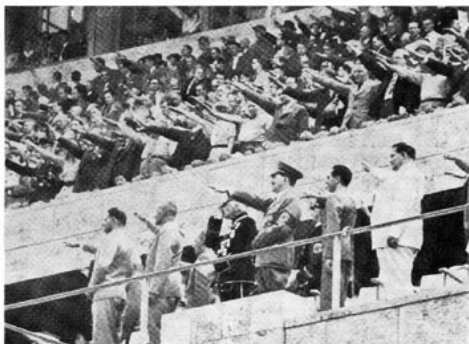
När nationalsocialisterna grep makten 1933 infördes ett planeringssystem av socialistisk modell som gjorde storindustrin beroende av staten från ungefär 1934. Då kunde nationalsocialisterna tvinga företagen att göra som de ville, men det var ett uttryck för den totala socialistiska kontrollen av företagsamheten. Före 1934 vägrade företagen att ställa upp. (Bilden från Berlin-olympiaden 1936).