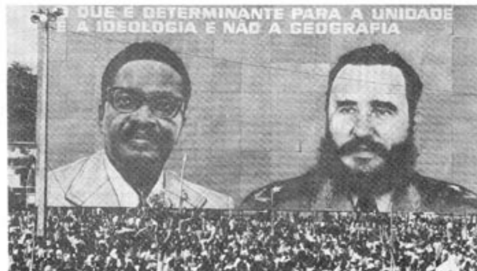
Kubans inflytande på MPLA-regimen i Luanda är stort. Här en jättebild på Angolas nu avlidne president Agostinho Neto och Kubas Fidel Castro vid ett gemensamt evenemang.