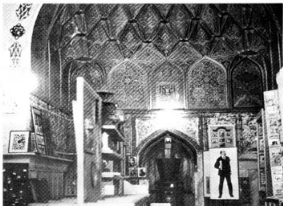
En rad fria stater i Kaukasus och Centralasien underkuvades under Sovjets första år. Bl a Bukhara, där denna muslimska helgedom omvandlats till kommunistiskt museum. Observera Lenin-bilden.

Det nya målet blev Estland, trots att Sovjetryssland år 1920 hade lovat respektera landets oberoende för evärdlig tid. Zinovjev ville