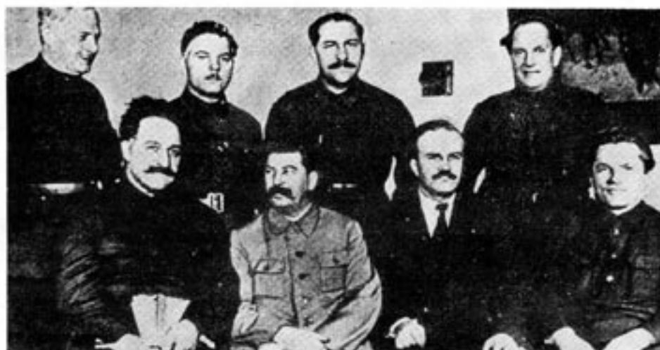
Det var Lenin som såg till att Röda hjälpen bildades, men under Stalin på 1930-talet nådde organisationen en höjdpunkt som utåtriktat organ. Idag verkar organisationen i det fördolda.

Många ledande röda hjälpare sade rent ut, att MOPR sysslade med proletariats klasskamp. Organisationens propagandapparat styrdes av Jemeljan Jaroslavskij (alias Minei Gubelman), som var expert på ateism, och specialister från folkkommissariatet för utrikesärenden: Karl Radek-Sobelsohn,