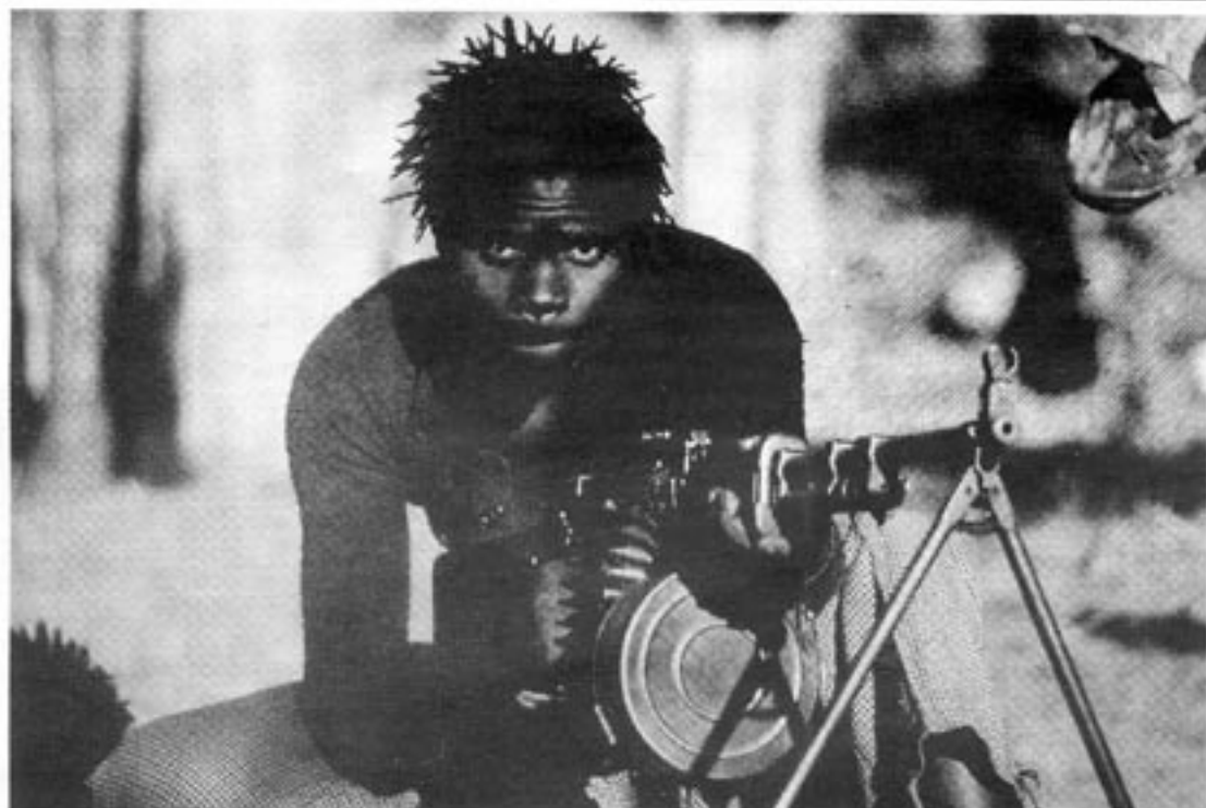
Den mozambikiska befrielse-rörelsen använder i huvudsak sovjetiska vapen. Här en guerillasoldat med en sovjetisk kulspruta.

det fanns också många övergivna byar, där ogräset tagit över. Tidigare portugisiska ris- och majsodlingar med apelsinlundar som växt igen och med byggnader i ruiner.