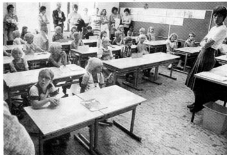
Låt kommunerna sälja ut skolorna på börsen!

Hur har jag kommit fram till den upp- fattning jag redogjort för här? Svaret är att jag smittats av filosofin objektivism . Objek- (Forts på sid 22)