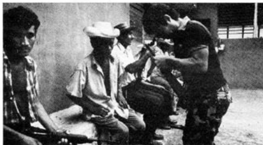
Här pågår utbildning av civilförsvaret i El Salvador. Länderna i Centralamerika behöver stöd från Väst för att stå emot Sovjets undergrävande verksamhet.