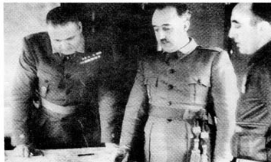
Folkfrontsregeringen i Spanien, som tillträdde 1936, höll på att skapa ett Sovjetspanien. Nationalisterna gjorde uppror och fyrtio års diktatur följde. Men hade Sovjetspanien blivit verklighet är det tveksamt om demokratin varit återupprättad idag. Här general Franco under kriget.

Många av de spanska barnen, som uppfostrades i sovjetiska internatskolor, anpassade sig dåligt till sovjetiska systemet. Enligt Alexander Solzjenitsyn straffades spanjorer, vilka längtade hem, som samhällsfarliga. De särskilt envisa dömdes för spioneri åt... USA (GULAG-arkipelagen, del I, s 88).