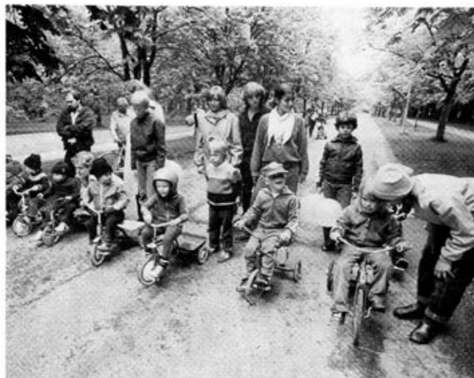
Att sträva efter goda resultat och att vara produktiv är naturligt för människan. Men onaturligt för den socialistiska välfärdsstaten.

Vilka är de produktiva? De produktiva är de som gör sig mödan att använda hjärnan.