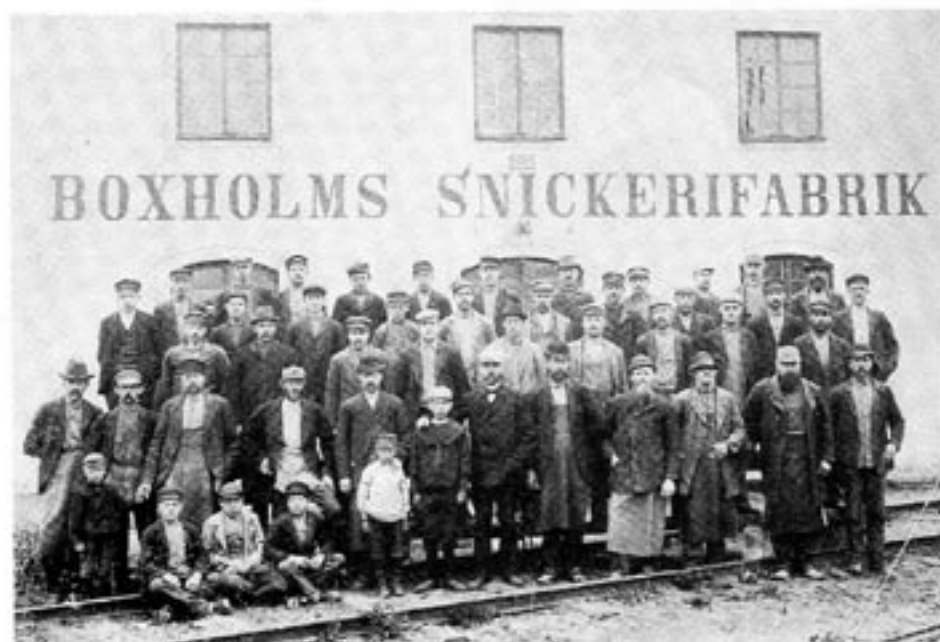
Vid sekelskiftet kunde det se ut så här vid en typisk fabrik. Det är kapitalism, inte statliga regleringar, som har gjort att välbudet utvecklats positivt sedan dess.

Sverige var dock en blandekonomi på 1800-talet, inte ett kapitalistiskt samhälle. Därför finns det missförhållanden. Dessa missförhållanden berodde på inslaget av étatism, av politiska kontroller, i samhället. Inte på inslaget av kapitalism, av frihet, i samhället. Men kapitalismen har kommit att falskeligen lastas för missförhållandena. Varför?