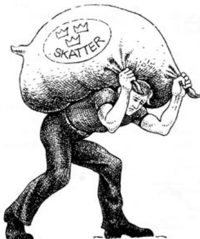
Det amerikanska skattetrycket är en bråkdel av det svenska. Men de amerikanska skattebetalarnas protester tilltar i styrka. De blir alltmer militanta.

Andra försöker komma ifrån skattmasen med andra metoder. En populär metod är ett program som kallas "jury power". I det amerikanska rättssystemet krävs ett enhälligt beslut från en jury för en fällande dom.