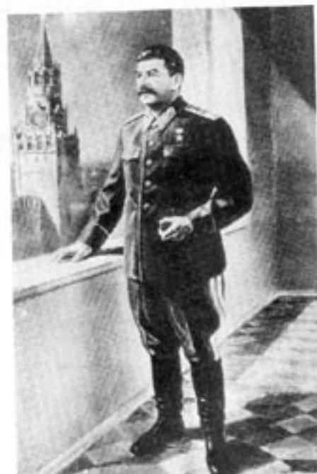
Back-channel-diplomatin utvecklades till fulländring av Stalin innan Andra världskriget. Palme vill använda sig av samma metoder i Sverige i mitten av 1980-talet.

Ett annat sätt att föra fram ett reellt budskap om vänskap med Sovjet vid sidan av protesterna för protokollet är att göra klart