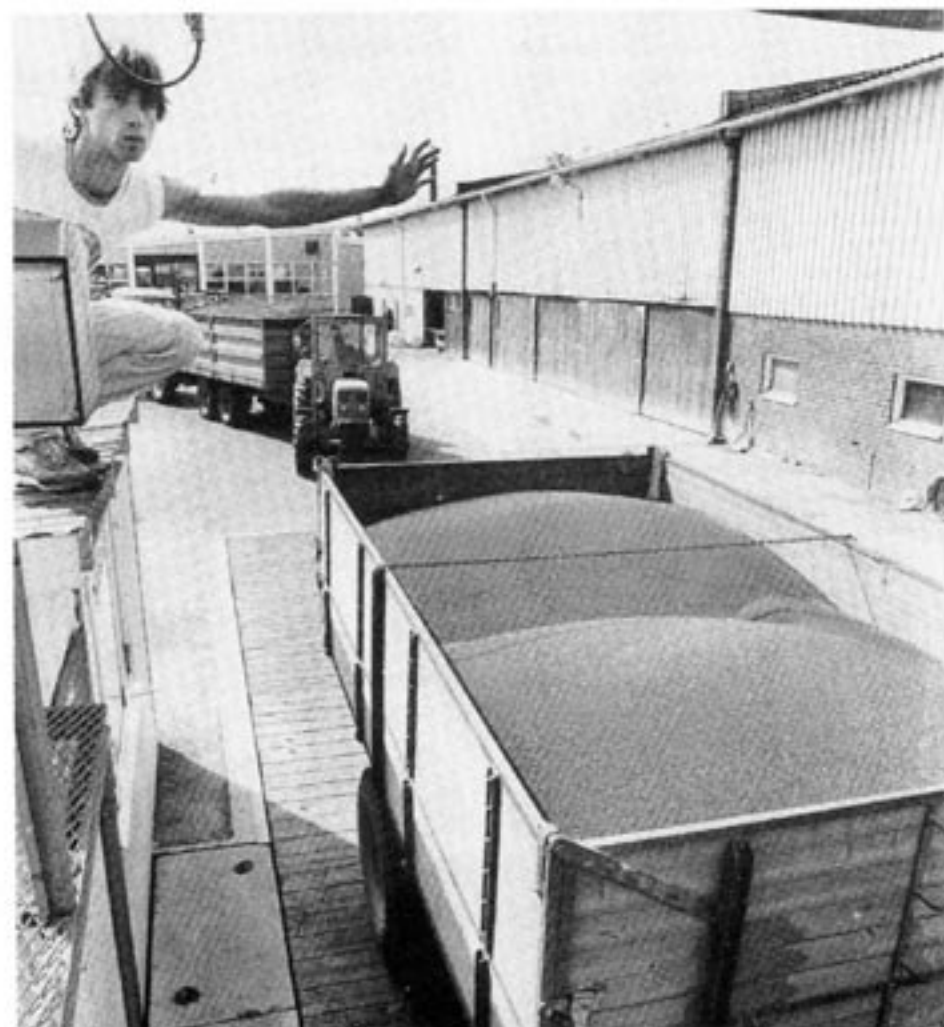
I de kapitalistiska industriländerna fylls magasinerna med jordbruksöverskottet. I de kapitalistiska u-länderna är livsmedelsbristen på väg att lösas. Men i de socialistiska u-länderna drabbas befolkningen av den ena hungerkatastrofen efter den andra.