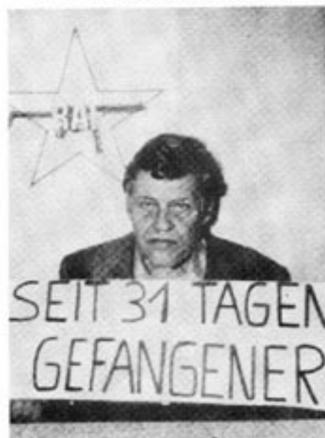
Baader-Meinhof-ligans höjdpunkt var mordet på Hanns-Martin Schleyer, ordförande i såväl arbetsgivarförbundet som industriförbundet i Västtyskland. Idag börjar terrorismen åter gå till offensiv, med Moskva i bakgrunden.

och Sovjet goda. Genom omfattande vapenleveranser och ekonomiskt stöd till PLO och dess underorganisationer har Sovjet och östblocket gjort palestinierna beroende. PLO:s utbildningsläger i Libanon, Syd-jemen och Syrien har varit medelpunkten för planläggning av internationell terrorism i många länder.