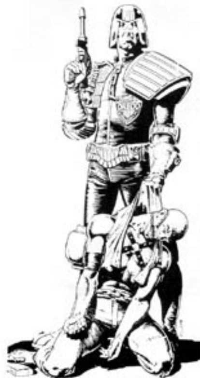
I serietidningarnas och pratbubblornas värld framförs nu åsikter som inte står på fötterna.