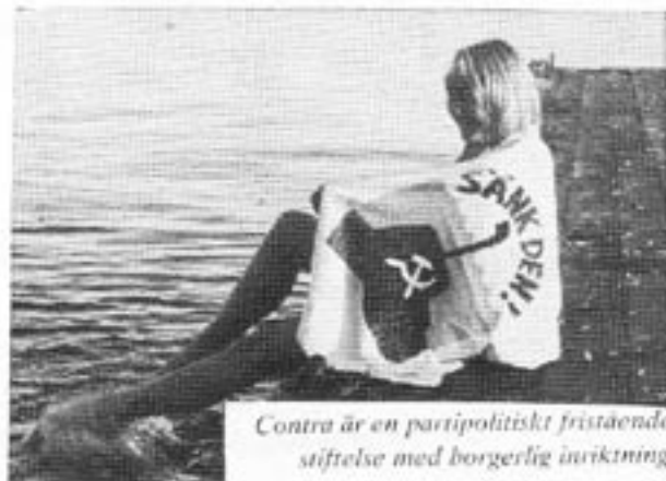
Contra är en partipolitiskt fristående stiftelse med borgerlig inriktning.