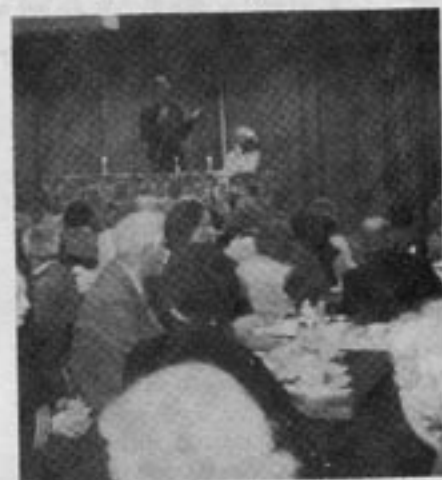
Biskop Stendahl medgav på ett möte att han i mycket hade gemensamma åsikter med vpk.

Krister Stendahl, den nye biskopen i Stockholm, har skapat rubriker bl a genom att påstå att det är synd att fly från skatteutplundringen i Sverige.