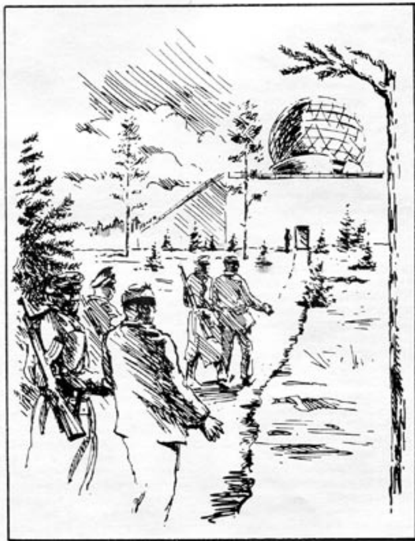
Svenska tekniker fördes med bindlar för ögonen till sovjetiska militära radaranläggningar för att justera in teknologi som smugglats in genom förmedling av halvstatliga företaget Datasaab.

Innan Datasaab övertogs av Ericsson var företaget halvstatligt. Det är därför ingen överdrift att påstå att svenska staten varit inblandad i datasmuggling.