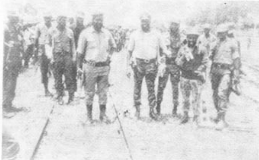
Jonas Savimbi, UNITA:s ledare, här efter befrielsen av sin egen hemstad Munango. Är en varm anhängare av fri företagsamhet. En väg att hindra sovjetisk frammarsch i Afrika, menar han.

— Vi är övertygade om att en UNITA-seger i Angola kommer att leda till ett slut för den sovjetiska expansionen i Afrika, och istället inleda dess tillbakagång. Vi menar exempelvis att den sovjetstötta regimen under Samora Machel i Mozambique inte skulle bli långlivad och att det sovjetiska inflytandet i