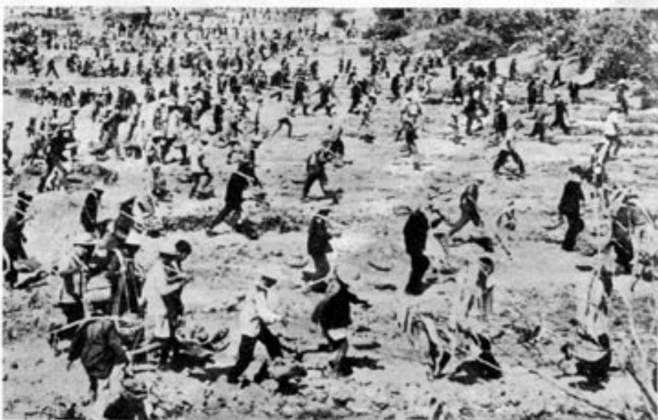
Bild från slavarbete i Kambodja.