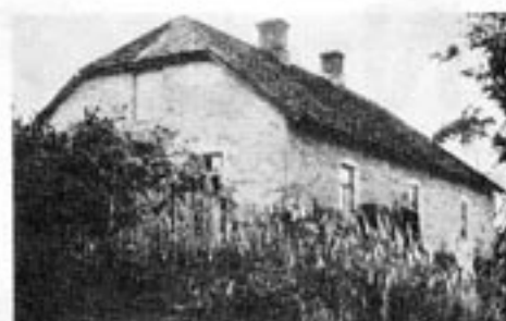
Bondgården nära Riga i Lettland där det kritiska förlaget Kristianis hade ett tryckeri.