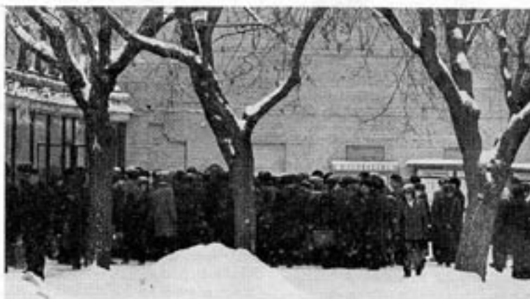
Den "grå" bokmarknaden vid Ivan Fjodorovs staty i Moskva.