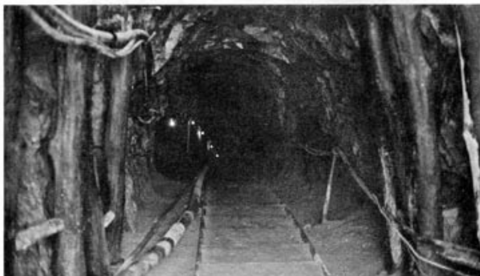
Infiltrationstunnel, byggd av Nordkorea för att föra personal och material under gränsen. Ett flertal sådana tunnlar har avslöjats.

Den nordkoreanska flottan har vid flera tillfällen angräpat och kapat sydkoreanska fiskebåtar, och båtar från den sydkoreanska marinen har sänkts. Detta har inneburit att Syd-Korea frivilligt har satt sin fiskegräns flera kilometer bakom den egentliga mittlinjen mellan norr och söder. Nu har emellertid nord-