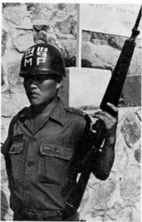
Sydkorea är berett att svara på eventuella angrepp från norr.

På grund av nordkoreanernas ständiga provokationer härskar en allmän antikommunistisk stämning i Syd-Korea. Både opposition och regering är överens om alla de säkerhetsåtgärder som måste vidtas och den anti-kommunistiska lagstiftningen. Parlamentet har också nyligen antagit resolutioner, som med bägge partiernas stöd, fördömer amerikanernas tillbakadragande av militär från Syd-Korea. Oenigheten gäller hur strängt man skall tillämpa de fullmakter som regeringen har, oppositionen har länge menat att president Parks regering missbrukar sina fullmakter på vissa områden.