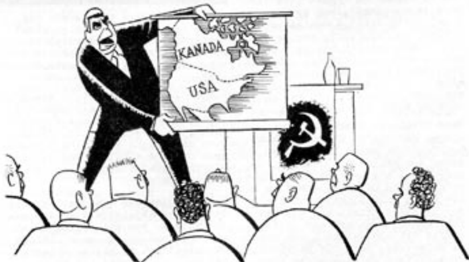
-Kamrater, låt oss nu se vad femårsplanen säger om veteproduktionen!

Det finns emellertid ett knep som ofta tillgrips och som innebär att man inte alls behöver meddela några prishöjningar. En tidigare bilmodell tas bort från marknaden och ersätts med en ny, nästan helt identisk, men med ett annat namn och ett betydligt högre pris. Då noteras ingen inflation i statistiken. Packföreningstidningen Trud har stått till tjänet med ett belysande exempel. I Vilnius (huvudstad i Litauen) köpte man vanligen ett fru-