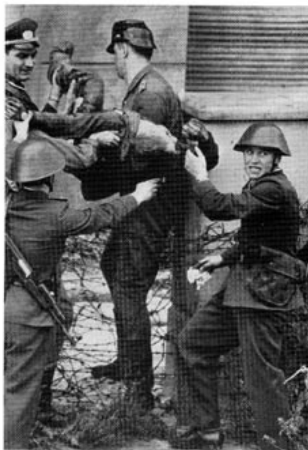
Östtysk polis bär bort Peter Fechtens kropp sedan denne skjutits till döds efter ett misslyckat flyktförsök till friheten i väst 1962.

Dessa operationer dirigerades av Moskva, men Wollweber hade före sin avgång i över fyra års tid varit direkt ansvarig för 1) sabotage mot Atlantpakts-