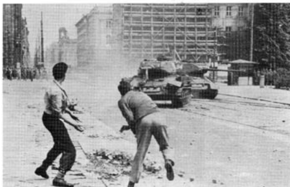
Östtyska arbetare mot sovjetiska stridsvagnar den 17 juni 1953. Ernst Wollweber återställde hemliga polisens järnhårda kontroll över 18 miljoner östtyskar.

Den 25 januari 1953 härjades 20 000-tonnaren "Empress of Canada" av brand när hon låg vid kaj i Liverpool. Den 28 och 29 januari bröt eld ut på Atlant-jätten "Queen Elizabeth", och den 30 januari inträffade liknande "olyckstillbud" som kunnat få allvarliga följder på de engelska hangarfartygen "Triumph" och "Warrior". Några dagar senare skadades 36 man vid en häftig explosion ombord på hangarfar-