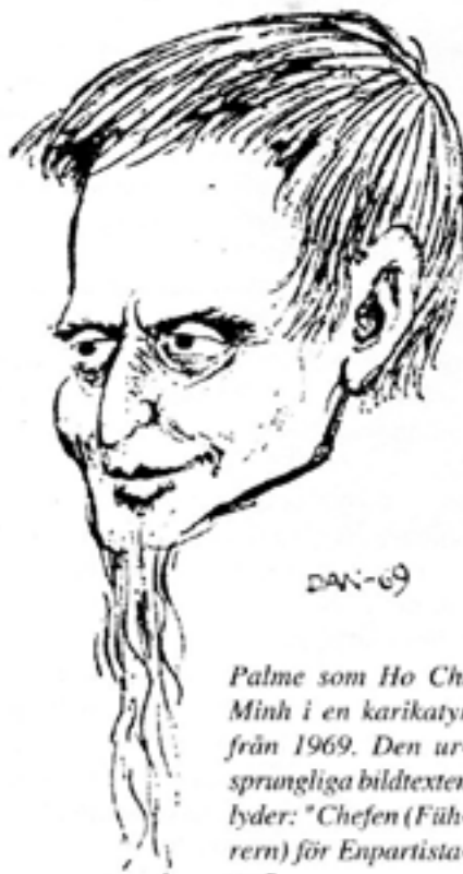
Palme som Ho Chi Minh i en karikatyr från 1969. Den ursprungliga bildtexten lyder: "Chefen (Führern) för Enpartistaten".

Den första allvarliga manifestationen av Olof Palmes USA-fientlighet inträffade, då han som statsråd den 21 februari 1968 vid en fackeldemonstration mot Förenta staternas åtagande i Indokina vandrade sida vid sida med Hanoi Moskva-ambassadör. Redan i ett tal vid Broderskapsrörelsens kongress i Gävle sommaren 1965