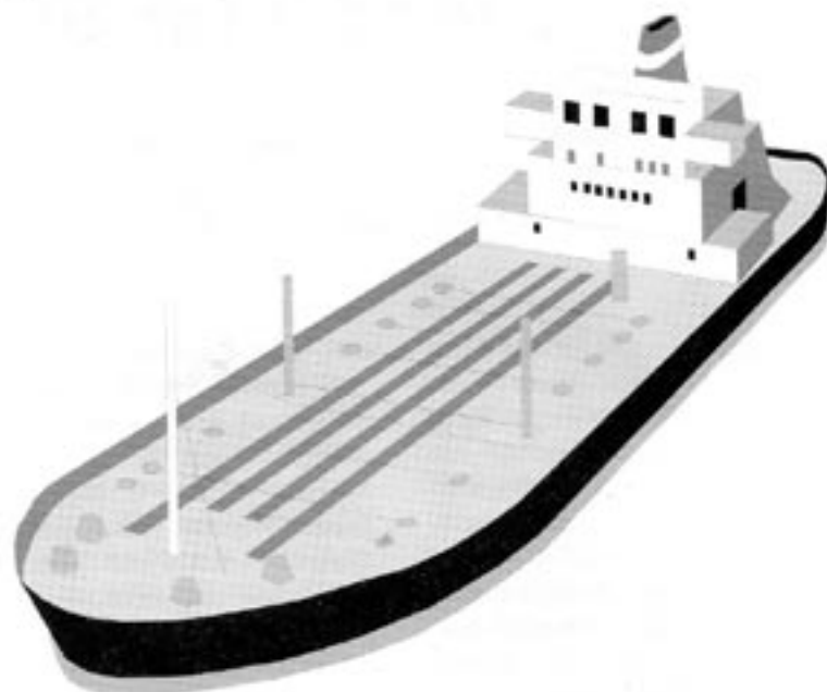
Alla skulle tjäna på en fortsatt liberalisering av världshandeln

"Grupper från extremvänster, extremhöger, miljörelsen, fackföreningar och vissa, självutnämnda representanter för det civila samhället samlas runt ett gemensamt mål: att rädda utvecklingsländerna från – utveckling".