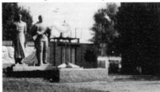
Stalin och Lenin har försvunnit utanför kommunalhuset i den lilla byn Ploskaja på Kuban-slätten. Istället två soldater. Anmärkningsvärt nog äras här även de som deltog i inbördeskriget.