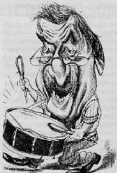
Günter Grass slår på propagandatruman...

Akademiens val av pristagare har blivit något av ett problem för Sveriges natio-