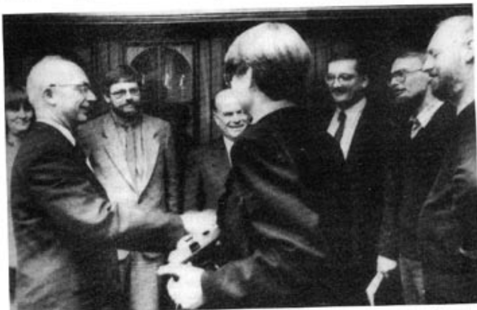
En delegation från Radikale venstre besökte det östtyska (kommuniststyrda) Bondepartiet i november 1986.

tiet beskrivas som en mer vänsterorienterad variant av det svenska Folkpartiet. Partiet har följdriktigt ingått i både socialdemokratiska och borgerliga regeringar.