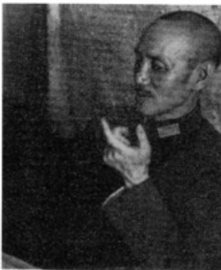
Chiang Kai-shek och hans Kuomintang-regering motarbetades av de landsförrädiska amerikanska vänsterkretsarna.